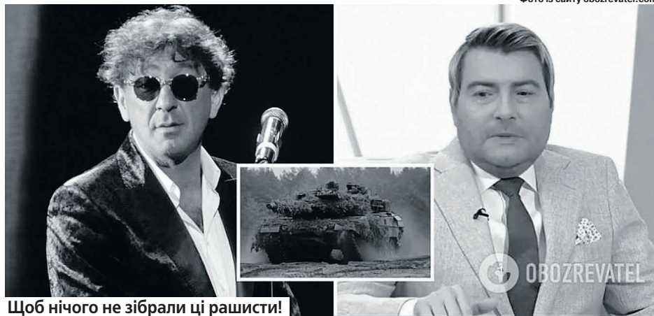
Щоб нічого не зібрали ці рашисти!

виступали з підтримкою цілей спецоперації та політики російської влади. Тому цирк із мільйоном рублів цілком передбачуваний.