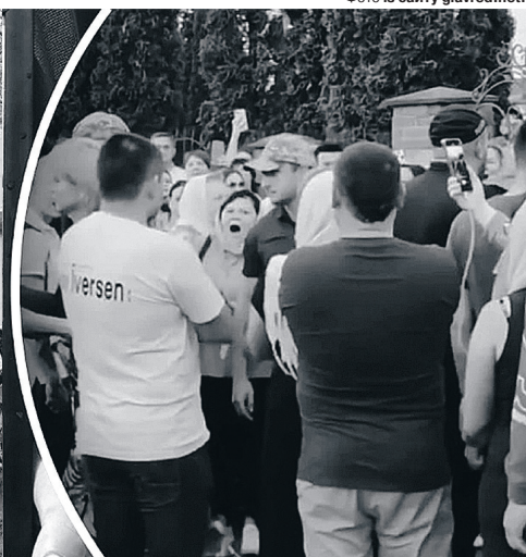
На жаль, і за цих ватників віддав своє життя Герой Іван Кушнірук.