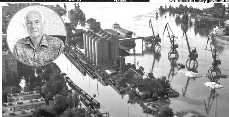
Фотоколлаж із сайту glavcom.ua.