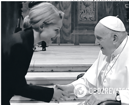
Фото із сайту obozrevatel.com.

«Цей щоденник, як послання до Бога, уособлює не тільки біль, він уособлює відвагу цілого покоління дітей, які сьогодні переживають війну проти України».