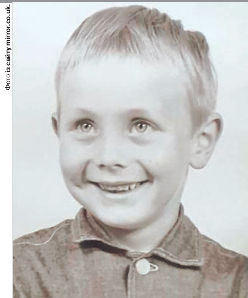
Хлопчика залишили у картонній коробці на морозі.