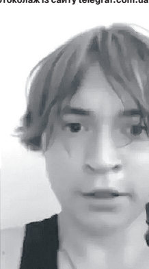
Ім би жити ще й жити...