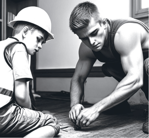
Спільні справи зміцнюють родинні зв'язки.