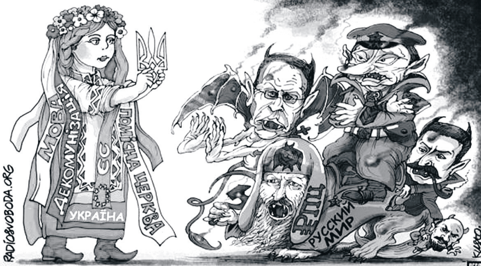
Кожна відрізана ниточка, яка з'єднувала нас із «руським міром», збільшує шанс на те, що нашим дітям не доведеться воювати з ордою.

Російська православна церква продовжує «віджимати» від так званої Української православної церкви московського патріархату цілі єпархії. Цими днями РПЦ підпорядкувала собі Донецьку та Горлівську єпархії упц мп на окупованих територіях. Але ніяких обурень, звернень до світового Православ'я з цього приводу від «незалежної» упц мп