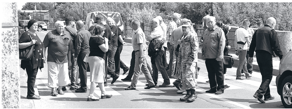
Люди привертати увагу громадськості до приголомшливого відкриття.