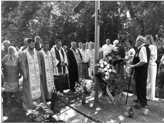
Молитва на Куповальцях була велелюдною.

До 1943-го на місці, біля котрого тепер стелиться дорога до Берестечка й родять людям