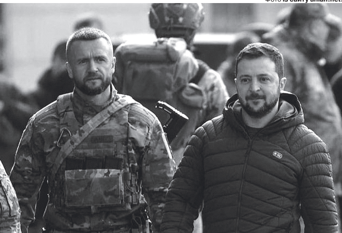
«Знав усе про Коломойського, знав усе про Палицю, тепер знає все про Зеленського».