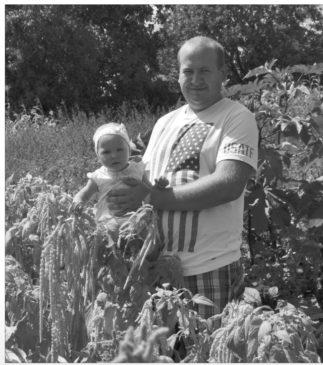
«Силу цілющих трав я випробував і на собі».

І цього року природні ліки ростуть на моїх грядках. Частина рослин з Тибету мені привіз товариш, котрий живе і працює у тибетському монастирі Сера. Трави дуже пахучі і гарні, але головне – надзвичайно помічні. У цьому я вже переконався не один раз. Декілька років тому в моєї мами стався інсульт з крововиливом у мозок, і прогнозами лікарі не тішили, адже були втрачені функції мови та руху. Я підібрав, керуючись розумною книгою і порадою товариша, суміш трав, значною мірою тибетських, вирощених власними руками. Три місяці регуляр-