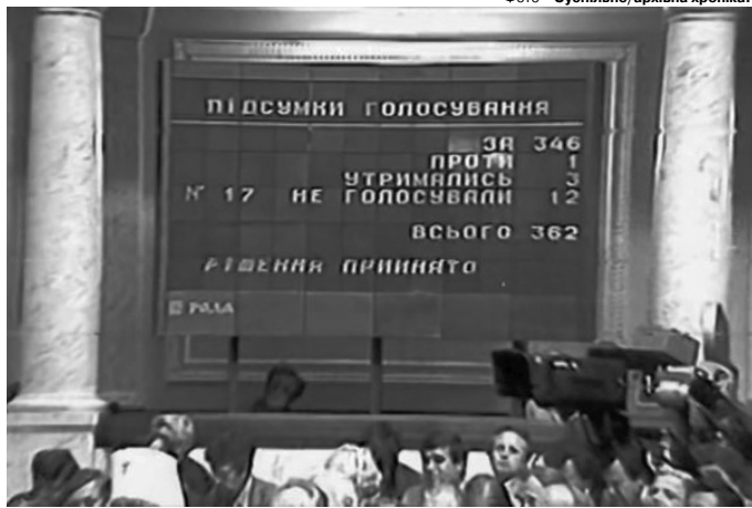
Результати історичного голосування у Верховній Раді 24 серпня 1991 року.

2. На Всеукраїнському референдумі 1 грудня 1991 року народ ухвалив рішення про проголошення незалежності української держави. На аркуші було лише одне запитання: «Чи підтверджуєте ви Акт про-