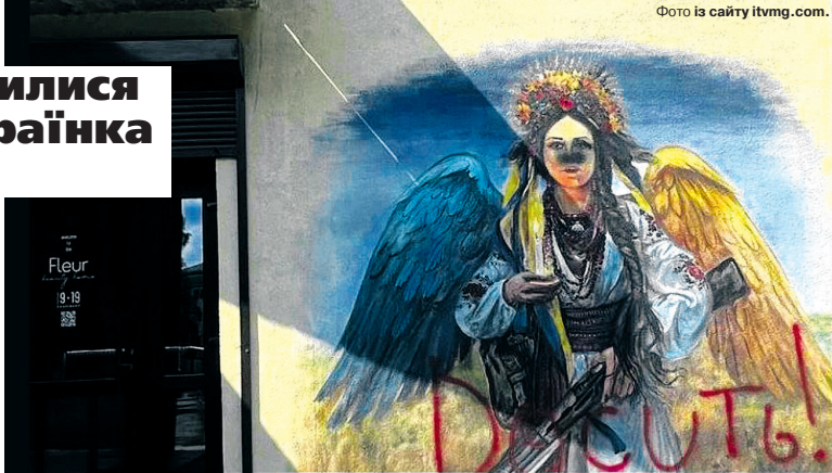
Нічого святого в того виродека, хто осквернив це зображення...