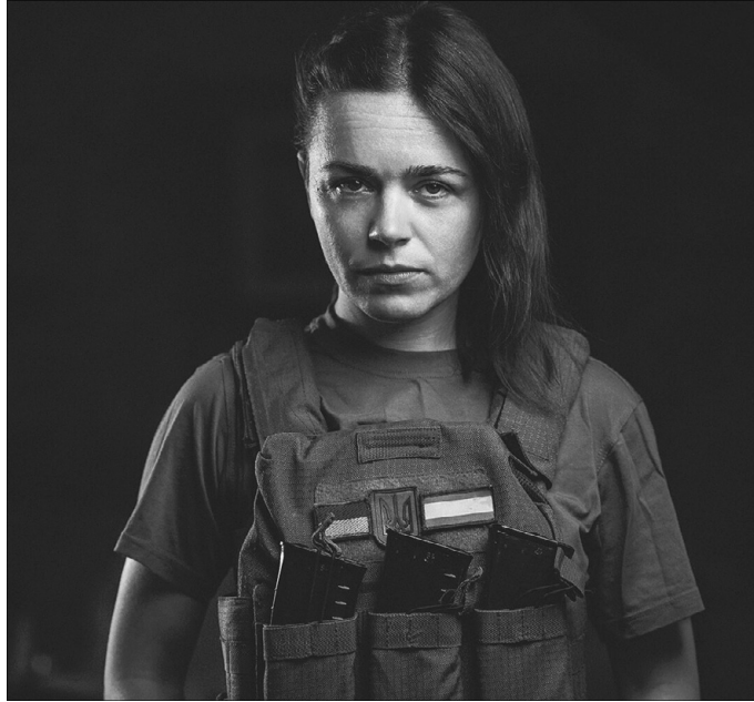
«Я не могла дивитись на те, як окупанти нищать наші міста, розуміла, що треба щось робити».

– Я не могла дивитись на те, як окупанти нищать наші міста, розуміла, що треба щось робити. Спочатку допомагала біженцям, а пізніше