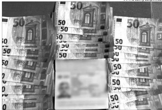
Підозрюваним вдалося переправити за кордон 20 військовозобов'язаних чоловіків.

Жителів Рівненщини підозрюють в організації каналів переправлення військовозобов'язаних чоловіків за кордон завдяки системі «Шлях»