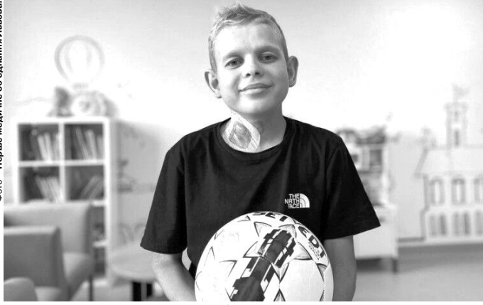
ФОТО – Перше медичне об'єднання Львова.

За словами батьків пацієнта, спочатку в Сашка з'явилися набряки та зменшилася кількість сечі. Невдовзі нирки повністю відмовили. Як встановили медики, такий стан зумовила аутоімунна хвороба – системний червоний вовчак. При цьому захворюванні імунна система виробляє антитіла, які ата-