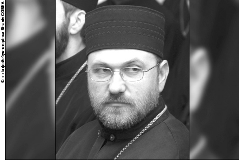
«Ми зробили важливий крок і відійшли від московії, в тому числі ще й у календарному питанні».