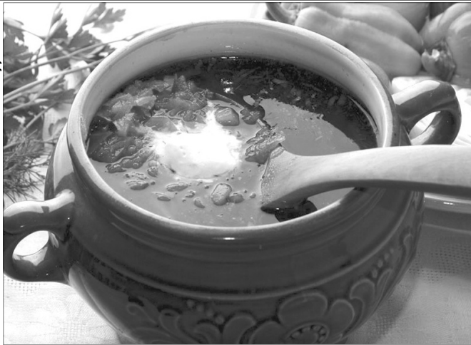
Борщ – він як кунг-фу. Ти можеш готувати його все життя, але так і не досягнеш рівня бабусі.

Календар гастрономічних свят підказує, що у другу неділю вересня в Україні відзначають День борщу. Цілком логічно: зібрани врожай овочевих культур – майже всі вони згодяться для смачного борщику.