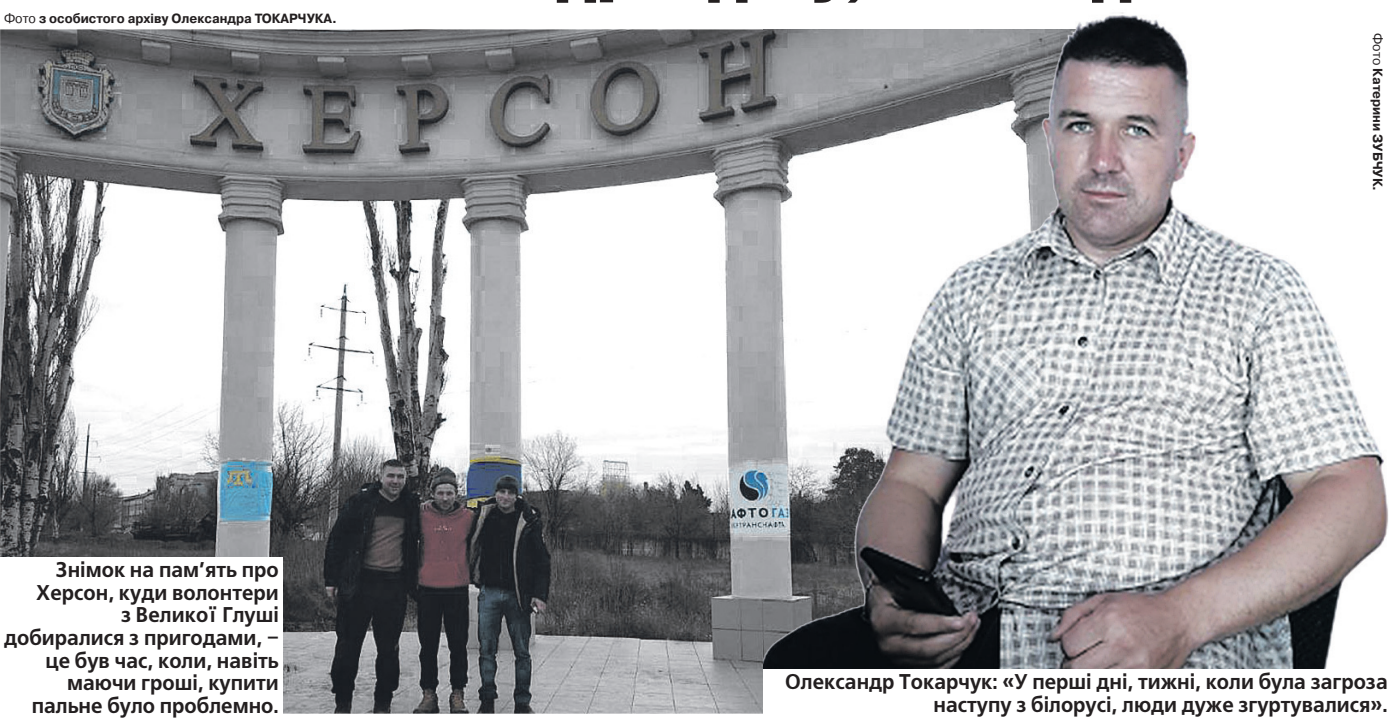
Знімок на пам'ять про Херсон, куди волонтери з Великої Глуші добіралося з пригодами, – це був час, коли, навіть маючи гроші, купити пальне було проблемно.

Олександр Токарчук: «У перші дні, тижні, коли була загроза наступу з білорусі, люди дуже згуртувалися».