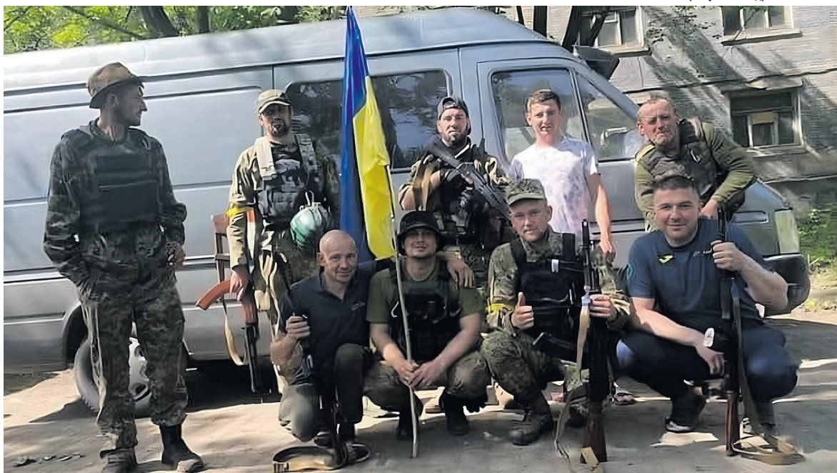
Волонтери з Великої Глуші зустрілися з бійцями-односельцями у Костянтинівці на Донеччині, коли привезли їм амуніцію, продукти (староста на фото в першому ряду крайній справа).