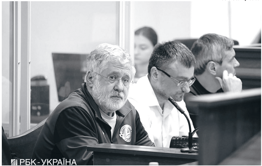
РБК - УКРАЇНА

Але дозволити цього не можуть, бо він надто багато знає. І