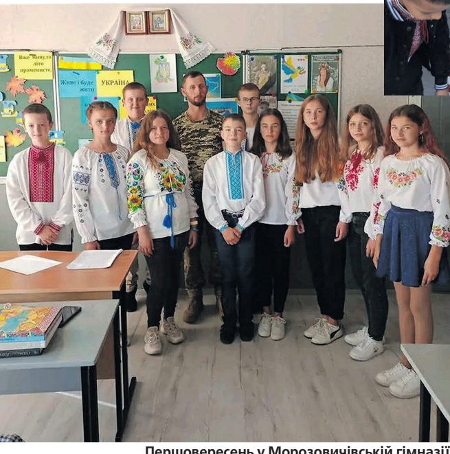
Першовересень у Морозовичівській гімназії.

Вісім літ трудиться на педагогічній ниві в Морозовичівській гімназії Поромівської територіальної громади цей педагог. Торік 25 лютого він був мобілізований до лав ЗСУ й досі несе службу. Захисник України вперше за більш як півтора року гостює у рідній школі. Але від початку повномасштабної війни колектив навчального закладу та учні