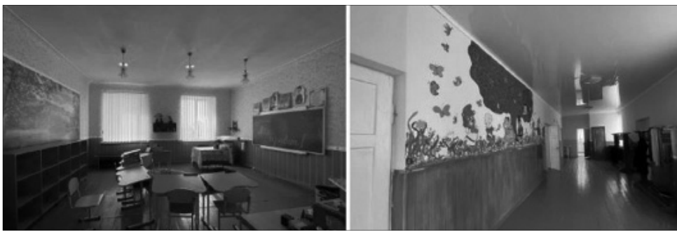
Школа в Лежниці справді гарна.