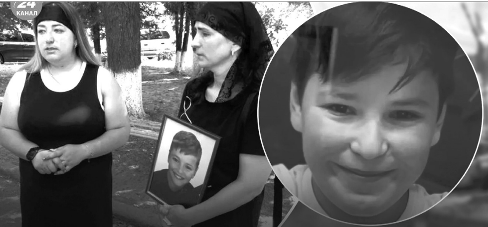
«Ми хочемо одного: щоб винних у смерті Богдана було покарано».