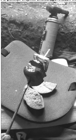
Вечера на двох із побратимом.

«Мужики, не здавайтеся, тримайтеся!». А рускіх він запевняє, що ногу йому не відріжуть – «через місяць-два, дай Бог, буду вас знову грохати...»