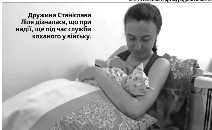
Дружина Станіслава Лілія дізналася, що при надії, ще під час служби коханого у війську.