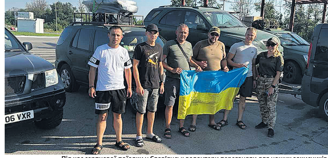
Під час серпневої поїздки у Слов'янськ волонтери переганяли для наших захисників чотири автомобілі.