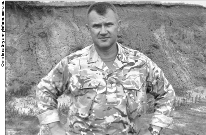
«Головне – це виконати бойове завдання й зберегти людей».

– Після спілкування – з чотирьох-п'яти кандидатів відбираю одного й записую собі в резерв. Таким чином, коли почалося розгортання сил ТРО і стало ясно, що попереду велика війна, в мене вже було ядро майбутнього