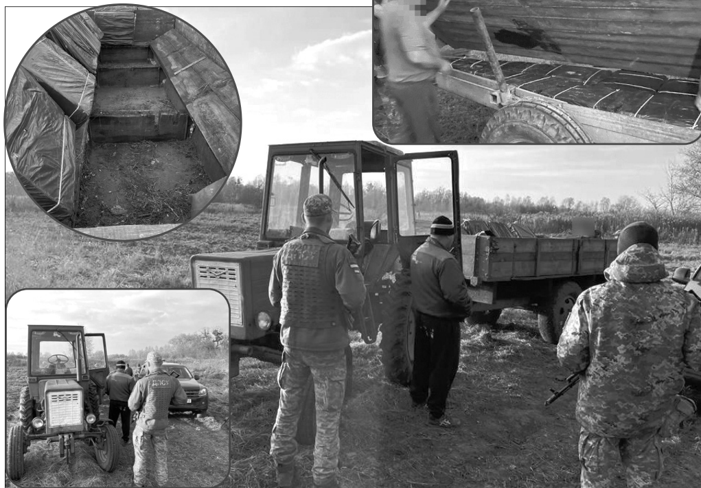
Про цей трактор уже кілька місяців гуде вся Україна.