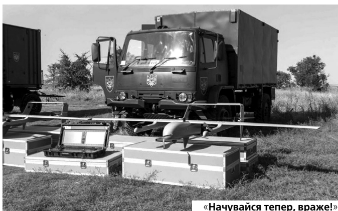
«Начувайся тепер, враже!»

«Мавіки, мавіки, мавіки... Хлопці радіють їм, як діти», – говорить Порошенко. Квадрокоптери DJI Mavic 3 PRO, які українські військові використовують для скидання боеприпасів на голови русні та ворожу техніку, передали 71-й окремій егерській бригаді, 78-му окремому штурмовому полку, 33-му окремому інженерному батальйону,