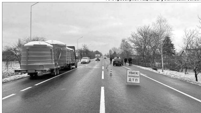
Місце трагедії в Торчині: дівчинка переходила дорогу поза межами пішохідного переходу, але «водій міг уникнути наїзду на дитину».

«Прошу розголосу! Ббивця моєї доньки втік за