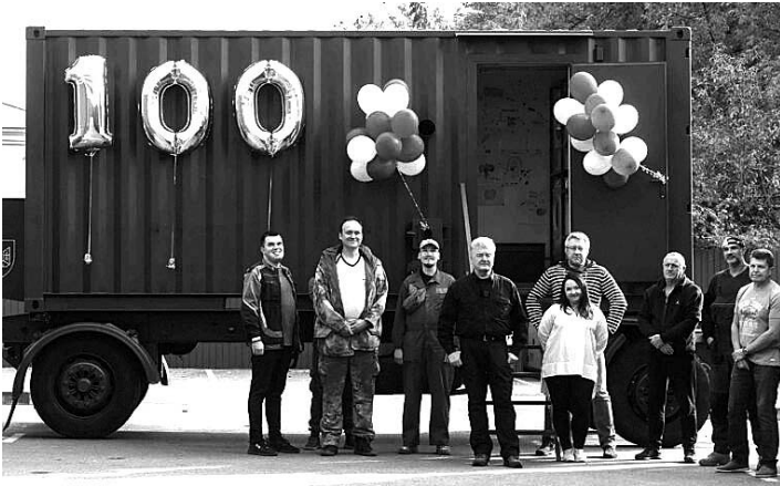
Черга на ці диво-вагончики не зменшується – тим паче, що попереду холодна зима.