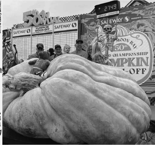
Гарбуз Майкл Джордан виріс завбільшки як приблизно 2110 баскетбольних м'ячів.