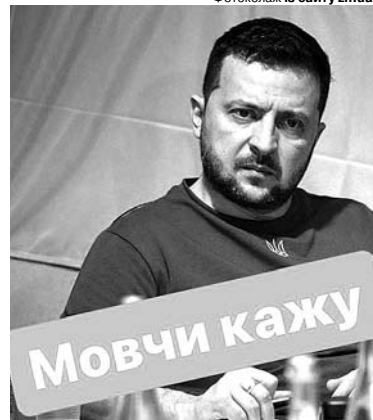
А мережа на оприлюднення інформації Юлією Мостовою відреагувала такими мемами на президента.

«Ви знаєте що? В плані корупції ми би прийняли ці умови, якби він збалансовано продовжив і