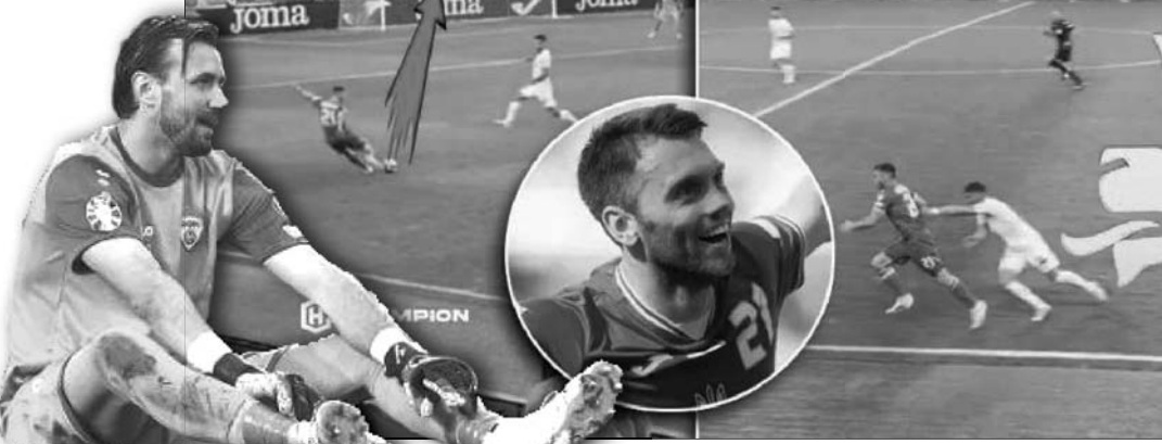
Фотоколлаж із сайту champion.com.ua.