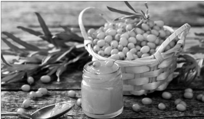
Ці дрібні непоказні ягоди – чудові природні ліки від тиску і стресу.