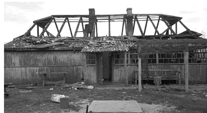
Ось що зробив вогонь із хатою СЕМЕНЮКІВ.