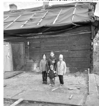
На фото – четверо дітей погорільців, батьки яких стараються по можливості відновити будинок до морозів.

то помітили над ганком клубок диму, вогню ще не було. На поміч уже бігли сусіди, які, побачивши кіптяву, викликали рятувальників. Як пізніше з'ясувалося, від електропроводки загорілася стіна коридору, звідки вогонь перекинувся нагору над усією будівлею. Тому першочергово полум'я охопило й знищило дах. Стіни хати вціліли, за винятком однієї, але залиті водою й потребують реставрації.