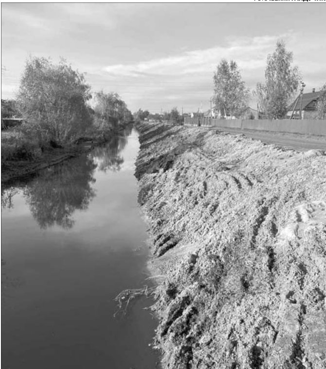
Розчищення річки врятує від підтоплення не лише існуючі домогосподарства райцентру, а й ті, що будуть у майбутньому.

У поліському райцентрі очистили від замулення та забруднення річку Цир. Крім того, формують захисну дамбу. Такі заходи проводять не лише з метою облагородження прибережної зони, але й для запобігання у майбутньому підтопленню житлових будинків, господарських споруд, земельних ділянок містян