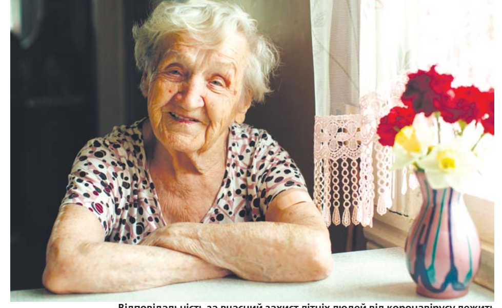
Відповідальність за вчасний захист літніх людей від коронавірусу лежить не тільки на медичних установах, а й на їхніх рідних.