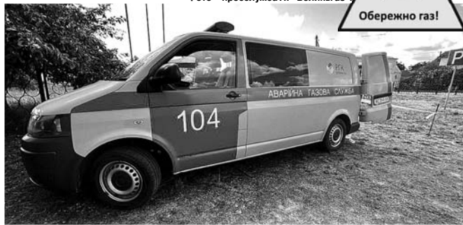
Аварійній бригаді довелося терміново їхати на виклик.

Власнику житла, який хотів зекономити, тепер доведеться відшкодувати збитки за проведення експертизи, заміну газових приладів та за відновлення газопостачання у квартирах, які позбавлені тепла і гарячої води.