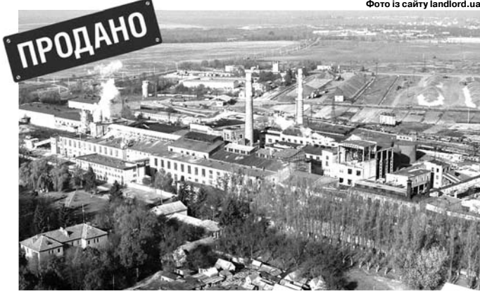
Гнідавський цукровий завод на околиці Луцька запрацював у 1958 році.

Як повідомляли в Антимонопольному комітеті, ТОВ «Радехівський цукор» подав заявку на купівлю підприємства у серпні цього року. АМКУ спершу не дав дозволу, оскільки укладення угоди