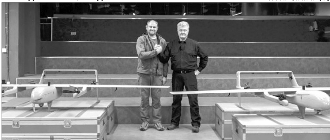
«Дуже уважно стежите за цим героїчним військовим з'єднанням і знайте: там, де 59-та бригада – там «Посейдони», там, де «Посейдони» з 59-ї – там Перемога».