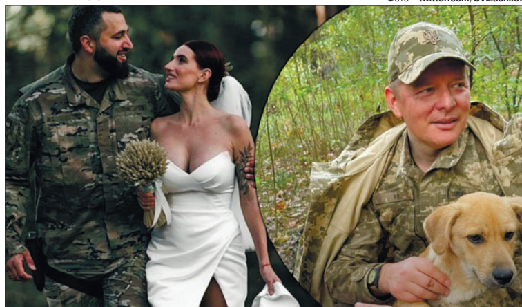
А ще рік тому Емеральд було за честь повідомити, що політик Олег Ляшко відвідав їхнє весілля на передовій.