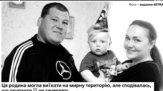
Ця родина могла виїхати на мирну територію, але сподівалась, що окупанти її не зачеплять...