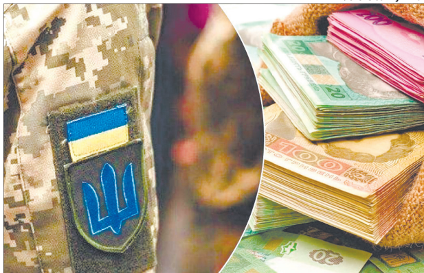
Бог дасть гроші, а чорт – дірочку, і підуть божі грошики в чортову дірочку.

Державне бюро розслідувань повідомило про підозру доньці та дружині посадовця військової частини з Рівненщини, які незаконно одержували бойові доплати.