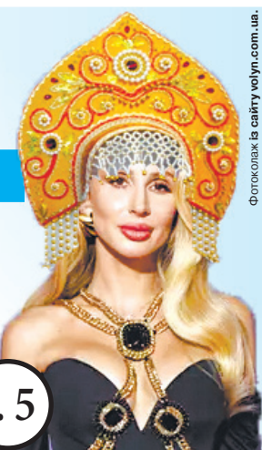
Фотосюжет із сайту volyn.com.ua.