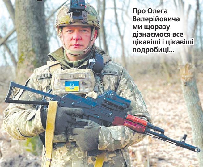
Про Олега Валерійовича ми щоразу дізнаємося все цікавіші і цікавіші подробиці...