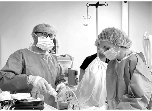
Завдяки професіоналам хлопчик отримав шанс на щасливе майбутнє.