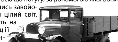
У мережі жартують, що наступного разу путіністи дістануть з музеїв тачанки часів громадянської війни.

На жаль, російська орда озброєна до зубів не лише «полупторками», а й сучасними зразками. І всю цю потугу, за допомогою якої вони збирались завойовувати цілий світ, кидають на позиції українських захисників.