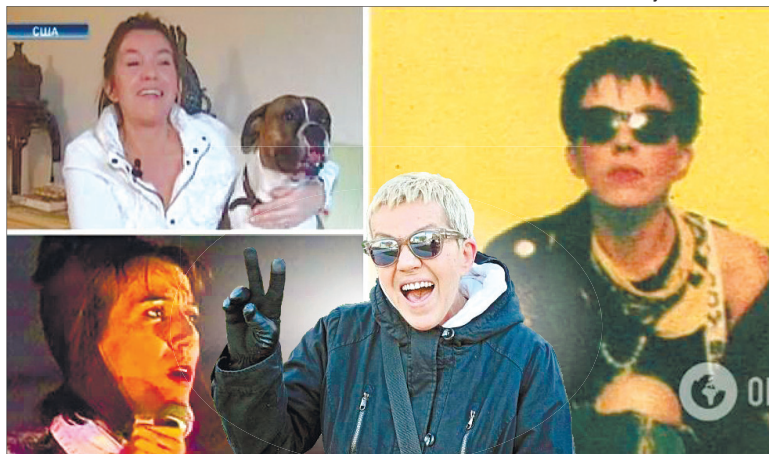
Вибухова понад 30 років тому співачка отримує в США 800 доларів пенсії і живе в соціальній кімнатці з песиком.

В Америці артистка не тільки співала, а й трудилася у шпиталі, кермувала таксі та працювала менеджером.