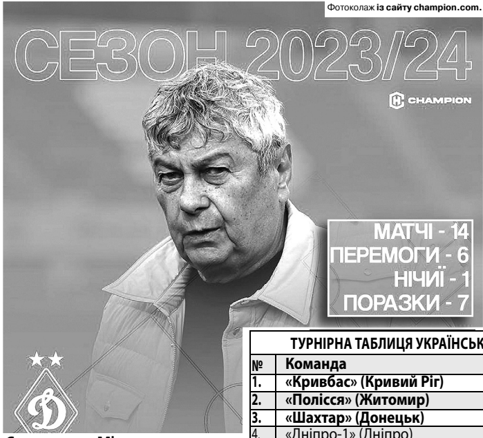
Статистика у Містера, як називають Мірчу Луческу, зовсім не містерська...

Звільнити його не можуть, бо за це треба платити.