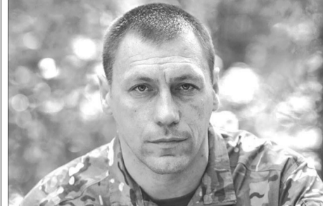
«Щоб зрозуміти, як долати ворога, – треба вбити принаймні одного особисто. Я вбив багатьох».