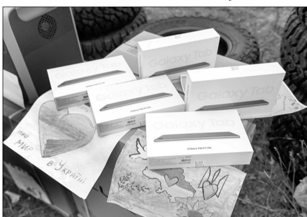
«А малюнки від малечі стануть оберегами для захисників».

«Нам передають волонтерську допомогу від фонду Петра Олексійовича для забезпечення нашого батальйону. Туди входить плівка, утеплювачі, кабелі, планшети і зарядні станції. У цьому завжди є необхідність, коли підрозділ працює у відриві від розташування, якраз цього нам не вистачає. Ті самі зарядні станції, та ж сама плівка – все це необхідно. Якщо ми перебуваємо подалі від розташувань, в полі – це все забезпечує наш побут. Чим бліндаж буде зроблений краще, тим зручніше буде солдат. Він буде сухий.