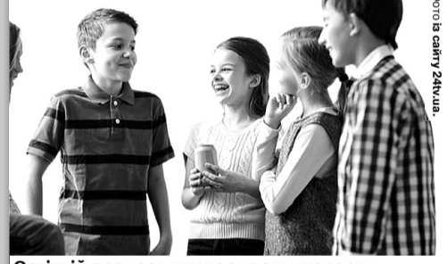
Освітній процес включає уроки, перерви, виховну роботу, спілкування у класах, учительських.

На його переконання, принципово важливо посилити мовні вимоги на всіх рівнях освіти. Адже порушення, за словами уповноваженого, з дитячих садків «переходять» у школи, а потім – в університети.