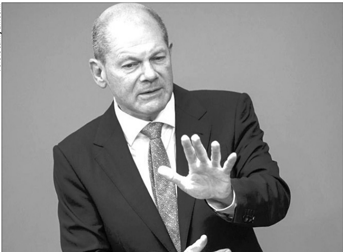
«Ми підтримуватимемо Україну стільки, скільки буде потрібно».

тимемося відданими й надалі, дотримаємося свого слова й продовжуватимемо підтримувати Україну – стільки, скільки буде потрібно. Ми не залишили жодних сумнівів щодо цього», – сказав глава німецького уряду.