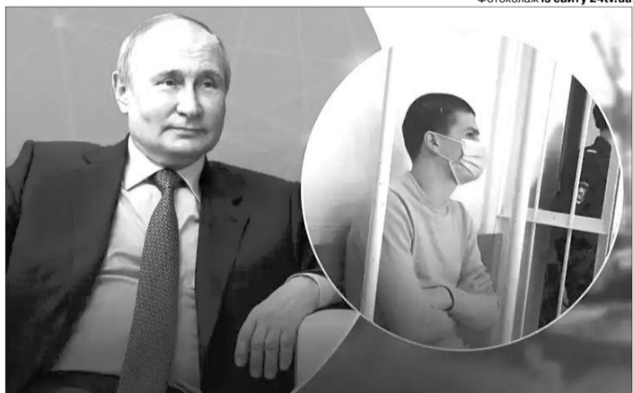
Кривавий тиран звільнив із-за ґрат нелюда, який заподіяв своїй жертві 111 травм, перед смертю її зґвалтував, а потім задушив шнуром від праски.