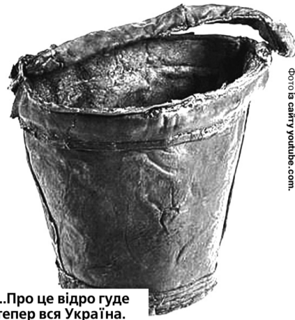
...Про це відро гуде тепер вся Україна.

Обвинувачена відчинила вхідні двері будинку, вибігла на подвір'я і почала сваритися з представниками поліції. Правоохоронці попросили припинити таку поведінку, однак жінка ще більше розлютилася і під час фізичного опору вдарила одного правоохоронця пластиковим відром у спину.