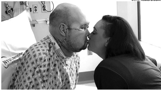
Чоловік отримав очне яблуко разом із кістками очної ямки та всіма навколишніми тканинами, включно із зоровим нервом.

Американські хірурги зробили прорив у медицині: їм вдалося трансплантувати пацієнтові ціле очне яблуко разом із частиною тканин обличчя. Операція насамперед мала сприяти косметичному ефекту, однак успішне приживлення органа дає надію, що чоловік навіть зможе бачити донорським оком