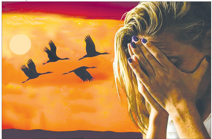
«І ось вона тут. Але боїться людського осуду».

– Майко, не думай викинути якогось коника. Чоловік у тебе – золото.