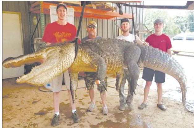
Якби у нас не було зими, то могли б відгородитися від росіян глибоким ровом із такими рептиліями.

Австралієць... відкусив у тварини шмат плоти і втік