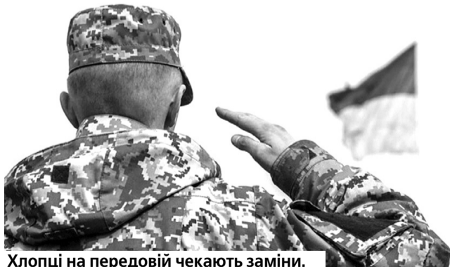
Хлопці на передовій чекають заміни.

Про це в інтерв'ю ТСН розповів військовий експерт, ексочільник пресслужби Генштабу ЗСУ, полковник Владислав Селєзньов. «Якщо ми згадаємо події 2014–2017 років, тоді відбулося шість хвиль мобілізації. Громадяни призивалися в рамках цих процесів на фронт, виконували інші бойові чи навчальні