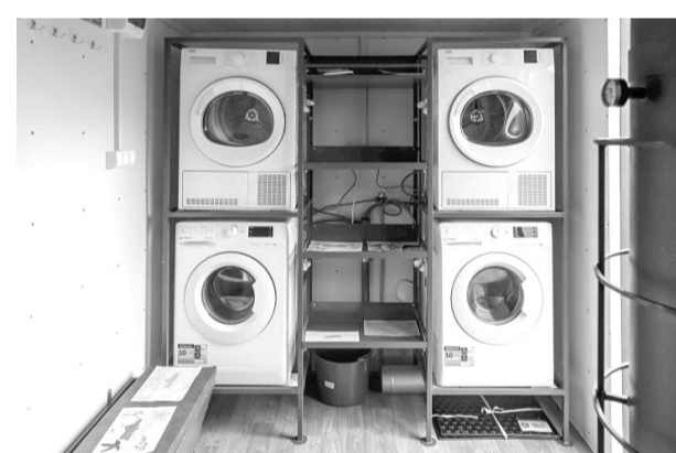
Команда Порошенка разом із волонтерами передали у військо вже 110 таких лазне-пральних комплексів.

«Зараз така погода, що переходимо з осені на зиму, тому якраз такі болотні шини нам дуже потрібні», – каже боєць.