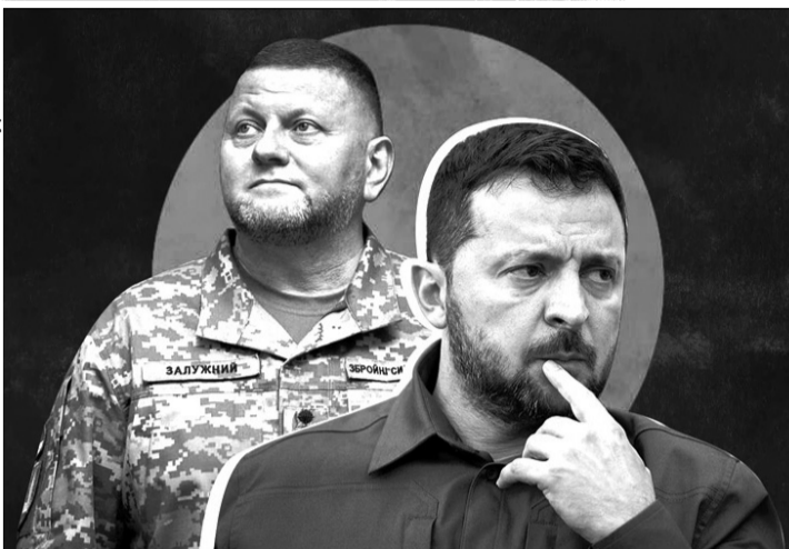
Не час для сварок, козаки!

Особливо старався будь-як ущипнути Залужного голова Офісу Президента Андрій Єрмак, дорікаючи, наприклад, тим, що в оточенні Залужного багато «порохоботів» (як відомо, нардеп від «Євросолідарності» генерал Михайло Забродський здав мандат і у квітні 2022 року пішов працювати заступником Залужного).