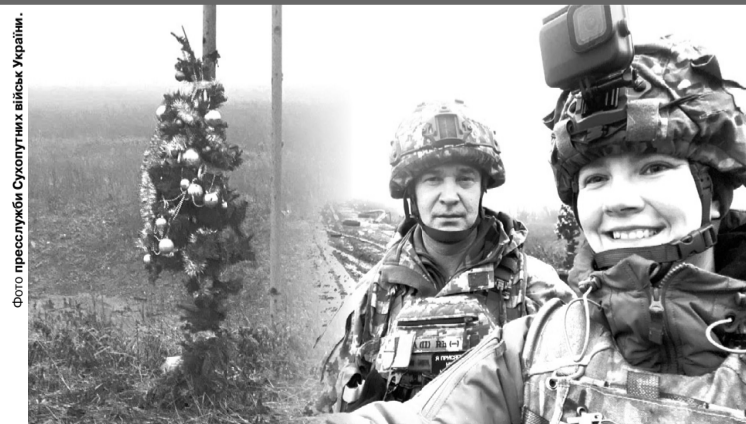
Навіть у самому пеклі війни наші захисники мають чудове почуття гумору. Нехай їх збереже Господь!

«До чого така відставка приведе гарантовано, то це до втрати ключової стратегічної переваги України над агресором: втрата єдності між двома лідерами може перерости у втрату внутрішньої єдності всього суспільства», – роблять вони висновок.