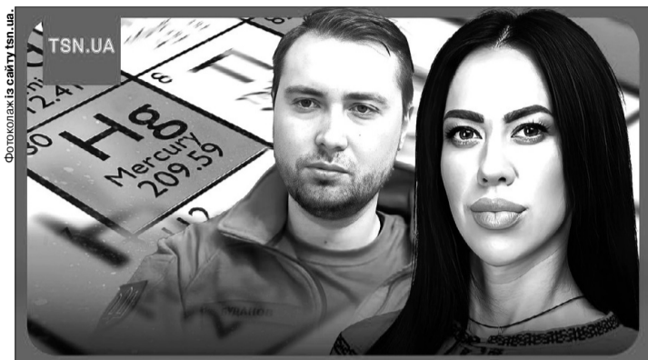
В організмі Маріанни лікарі виявили ртуть і миш'як.

Попри численні спроби, росіяни не можуть дістатись до керівника Головного управління розвідки Мінборони України Кирила Буданова, однак їм вдалося завдати шкоди його дружині Маріанні