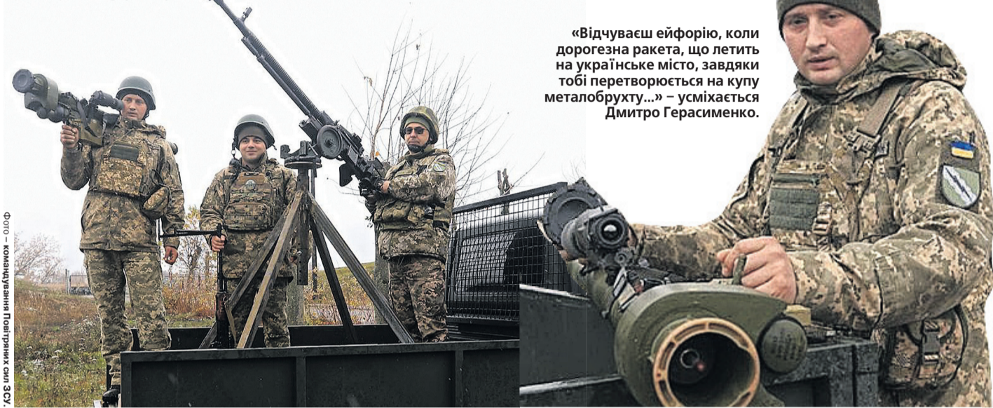
Фото – командувач Повітряних сил ЗСУ.

«Відчуваєш ейфорію, коли дорожня ракета, що летить на українське місто, завдяки тобі перетворюється на купу металобрухту...» – усміхається Дмитро Герасименко.