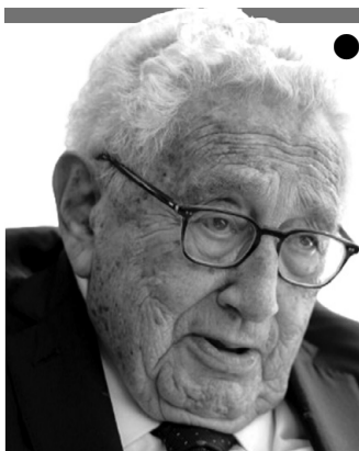
Президент Володимир Зеленський під час зустрічі з Генрі Кіссінджером, Нью-Йорк, вересень 2023 року.