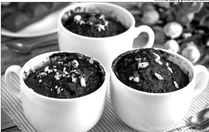
Звісно, така випічка – не для подачі гостям, але до ранкової кави цілком згодиться.

Приготування. Якомога тонше нарежьте картоплю, використовуючи овочечистку або комбайн. Тарілку мікрохвильової печі застеліть папером для випічки, змастіть його оливковою олією, викладіть по краях картоплю одним шаром, присипте сіллю та спеціями. Налаштуйте мікрохвильовку на повну потужність і поставте спочатку на 3 хвилини, потім додавайте час, потрібний для повної готовності (в середньому це займає до 8 хвилин і залежить від потужності мікрохвильової печі).