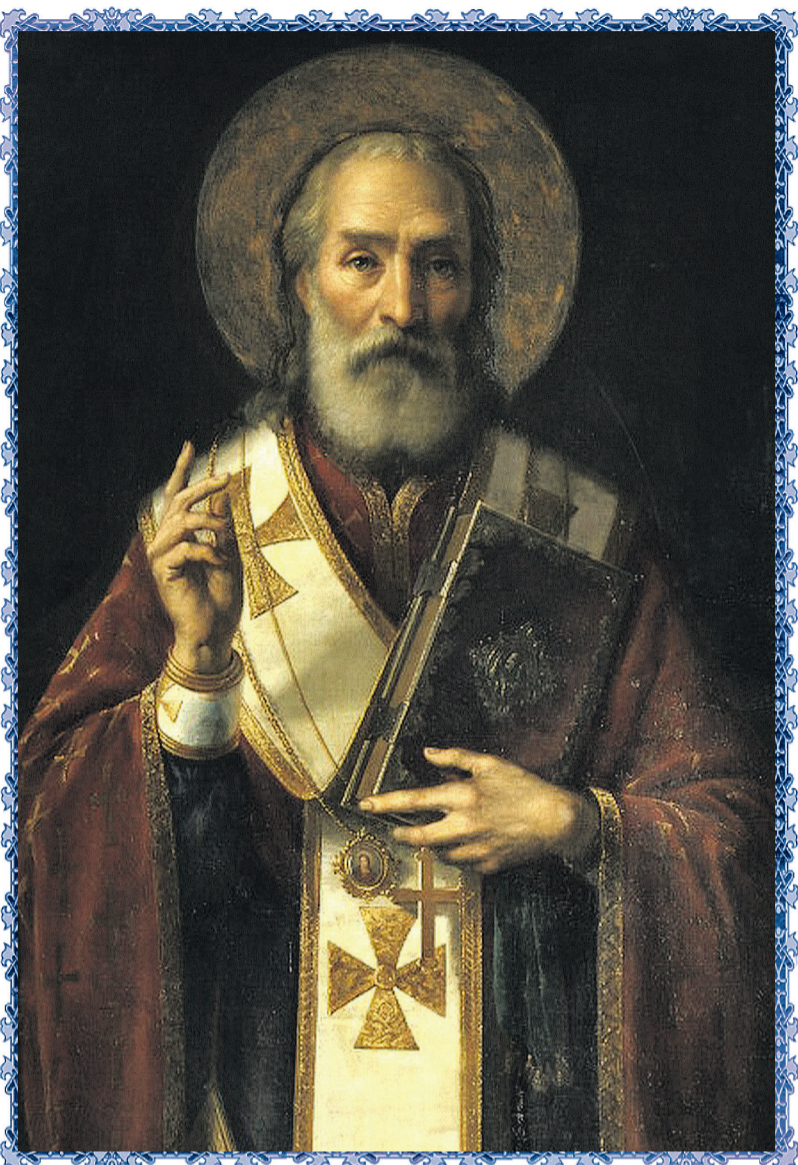
Святий Миколай на полотні Ярослава Чермака.