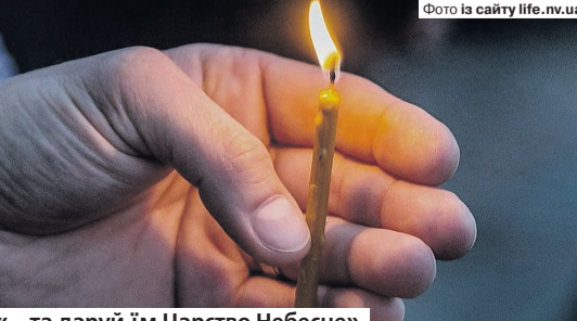
«... та даруй їм Царство Небесне».