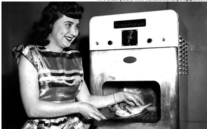
Перші мікрохвильовки були великогабаритними і важкими.

Подякують, ідея створення мікрохвильової печі спала Спенсерові на думку після того, як він, постоявши біля магнетрона (електронної лампи, яка генерує мікрохвильове електромагнітне випромінювання), виявив, що