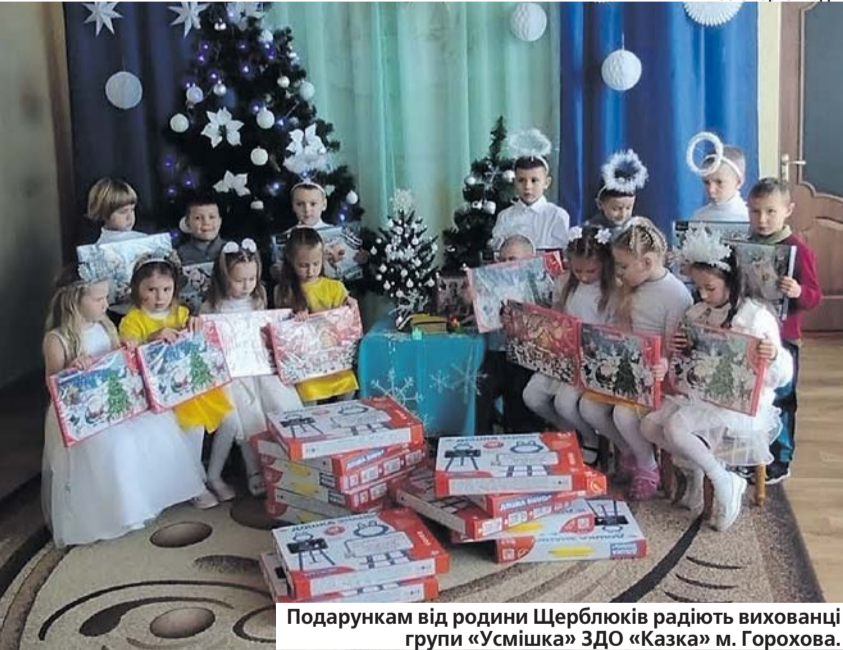
Подарунком від родини Щерблюків радіють вихованці групи «Усмійшка» ЗДО «Казка» м. Горохова.

У цьому закладі дошкільної освіти і найменшенькі малята, і дітки зі старших груп знають, що принаймні раз на рік дива обов'язково стаються