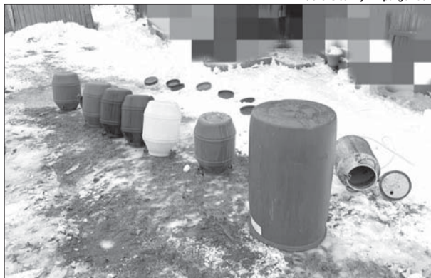
Закваска на самогон, яка була в цих бідонах, знищено.

ловік запасався нею не для власного споживання, а на реалізацію, що є порушенням закону та