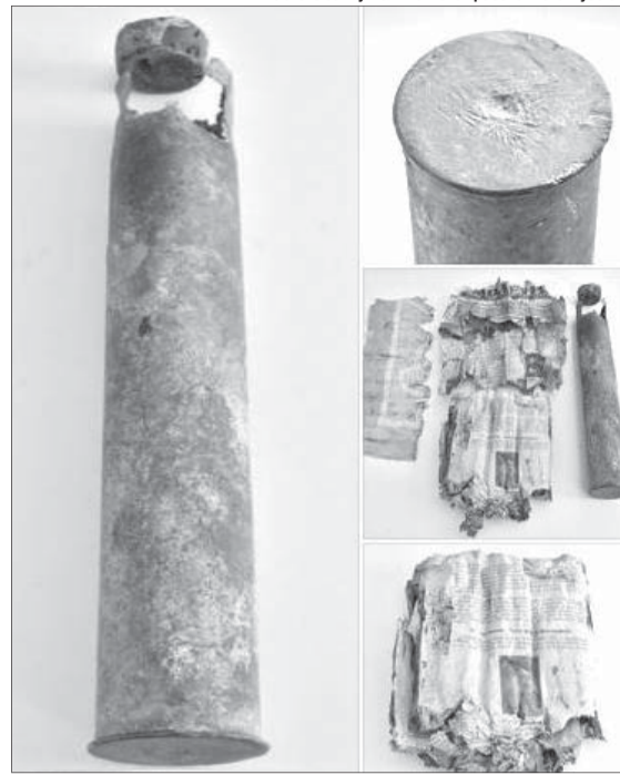
Стара артилерійська гільза і знайдені всередині українські друковані видання.

«Це – доказ того, як змінні окупаційні режими вели боротьбу з українською ідентичністю. Той, хто її (гільзу) закопав заради своєї безпеки міг усе знищити, але вочевидь, мав намір зберегти українське слово для себе і нащадків», – зазначили у Волинському краєзнавчому музеї. ■