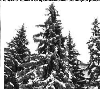
Цьогорічні декорації виготовлені руками працівників та вихованців «Старовижівського центру дитячої та юнацької творчості».

працівників та вихованців комунального закладу позашкільної освіти «Старовижівський центр дитячої та юнацької творчості». ■