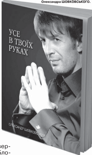
Обкладинка книги СаШо (так називають у «Динамо» Олександра Володимировича Шовковського).