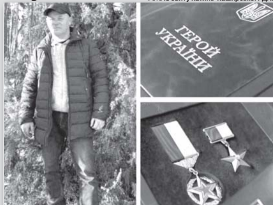
Життя Героя обірвалося під час мінометного обстрілу на Донеччині.