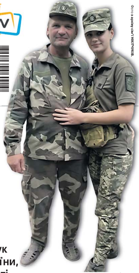
Батько й донька, яким хочеться побажати якнайшвидше повернутися додому з Перемогою!