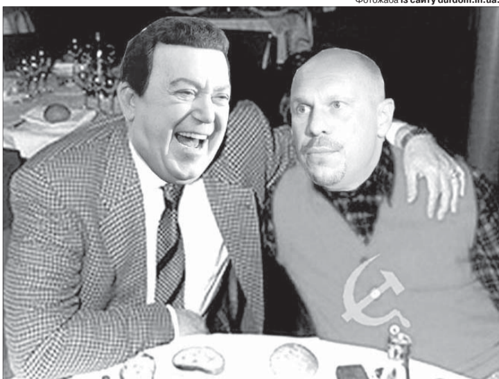
Фотожаба із сайту durdom.in.ua.

Віталій ПОРТНИКОВ, публіцист, письменник і журналіст, оглядач «Радіо Свобода», член Українського ПЕН