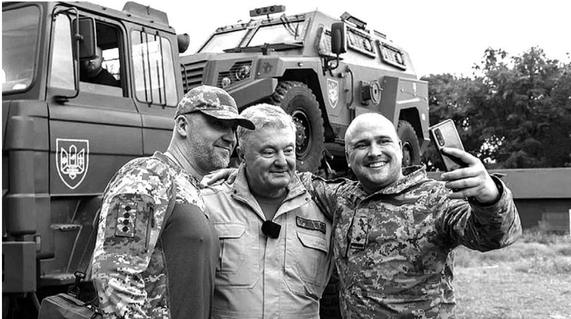
Петро Порошенко: «ЗСУ – найсильніший і найвідоміший у світі український бренд!».