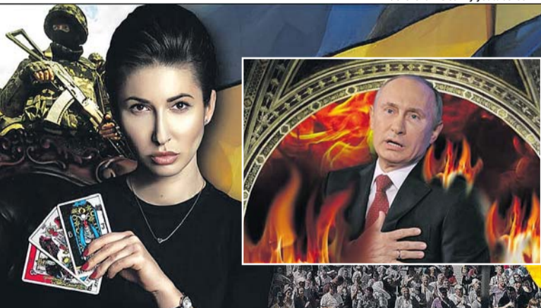
«Цієї зими в росії відбудеться розкол».

У пункті пропуску «Устилу» 39-річний житель Рівненщини спробував «вирішити» питання щодо безперешкодного перетину українсько-польського кордону, вручивши прикордоннику 1500 євро хабаря. Від неправомірної вигоди інспектор відмовився, а про виявлення ознак кримінального правопорушення, передбаченого ст. 369 Кримінального кодексу України (де передбачено максимальне покарання – до 4 років обмеження волі), прикордонники поінформували співробітників Національної поліції.