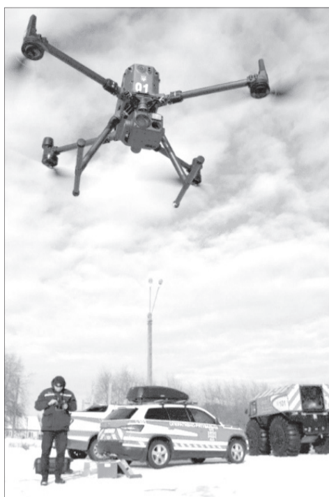
Для охоплення більшої площі огляду були залучені безпілотні літальні апарати.

Заходи спрямовані на запобігання підтоплення домоволодінь та контроль стану рівня води з метою оперативного реагування на можливі надзвичайні ситуації та надання допомоги людям у випадку їх ускладнення.