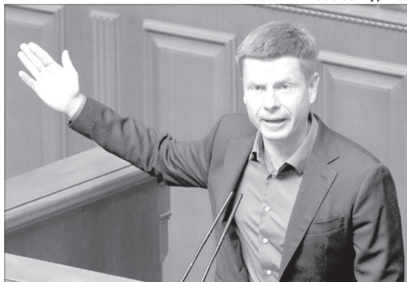
Вітаємо і тримаємо кулаки!

Про це Гончаренко повідомив у Telegram. Він зазначив, що