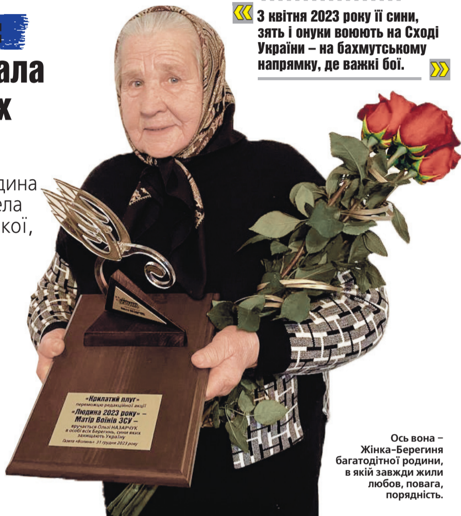
Ось вона – Жінка-Берегиня багатодітної родини, в якій завжди жили любов, повага, порядність.

« 3 квітня 2023 року її сини, зять і онуки воюють на Сході України – на бахмутському напрямку, де важкі бої. »