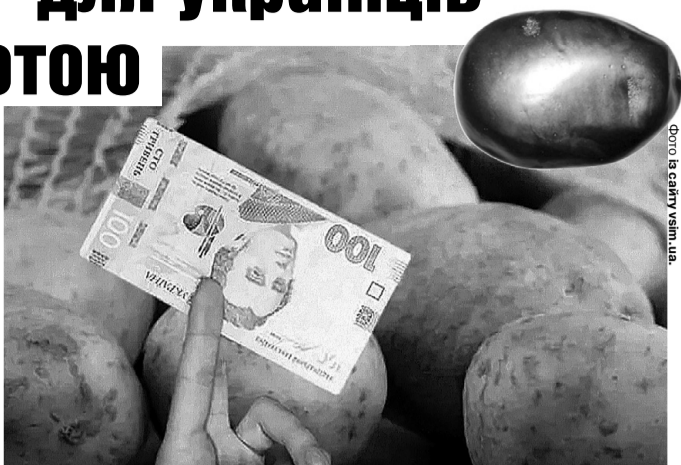
Виробники кажуть, що нинішня ціна – не межа. Вартість бульби буде зростати.