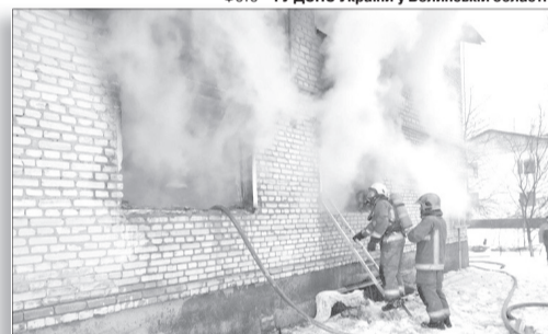
Рятувальники ліквідовують загоряння у селищі Любешів.