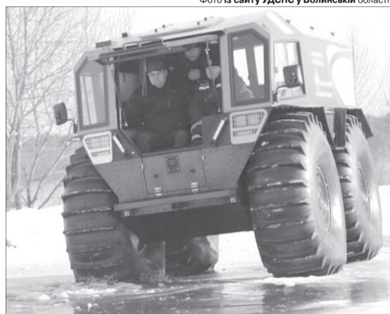
Учасники моніторингової групи об'їхали територію, що зазнали підтоплення, на снігоболотоході «Богун».