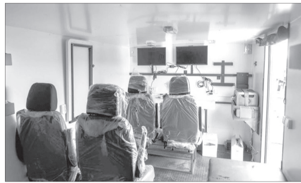
А в машині управління «Посейдонами» є все для комфортної роботи екіпажу – спеціальний пульт управління, робоче місце пілота, оператора, артилериста, зв'язківця.