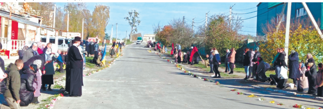
Навколiшки зустрічали земляки воїна-Героя, який повернувся додому «на щиті».