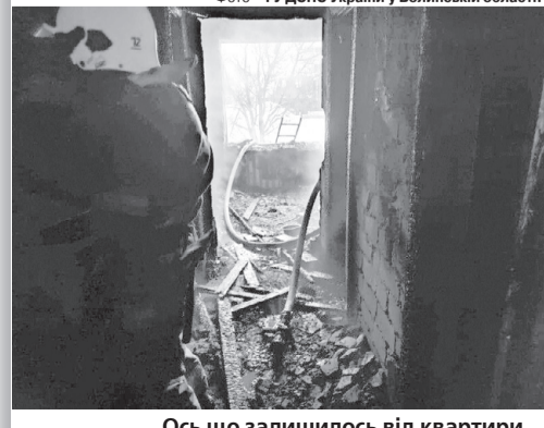
Ось що залишилось від квартири...