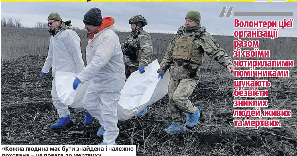
«Кожна людина має бути знайдена і належно похована – це повага до мертвих».