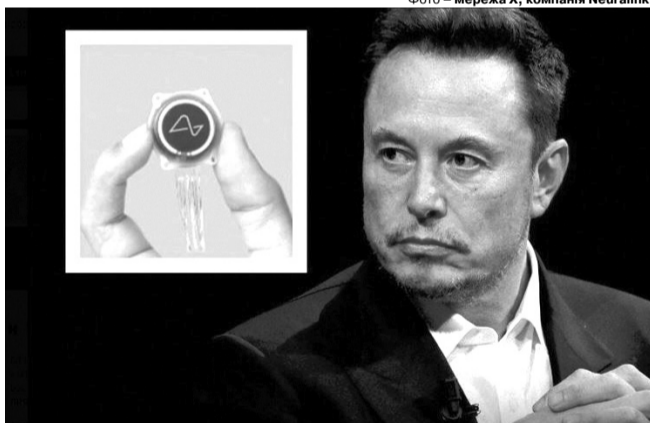
Перший продукт від Neuralink має назву Telepathy.

дають багатообіцяюче. Харчових продуктів і медичних препаратів і медичних ліній з контролю за якістю харчових продуктів і медичних препаратів і медичних ліній з контролю за якістю