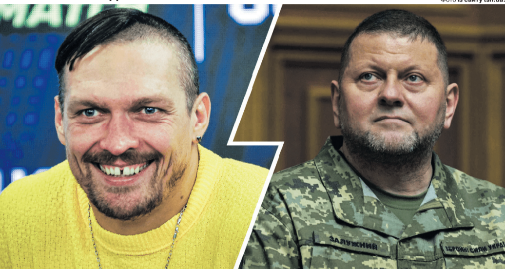
«Валерію Федоровичу, сказано в точку!»