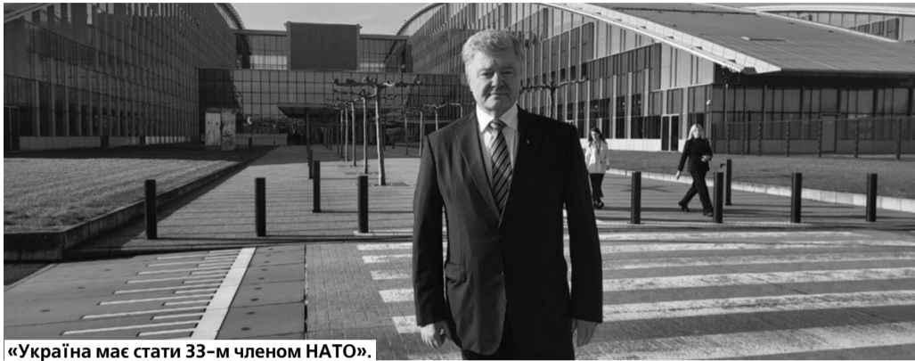
«Україна має стати 33-м членом НАТО».

П'ятий Президент України, лідер «Європейської Солідарності» Петро Порошенко в інтерв'ю бельгійській газеті De Standaard закликав Захід посилити санкції проти росії до такого рівня, щоб вона не могла нарощувати виробництво зброї