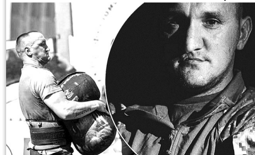
Силач навіки залишився 32-річним...