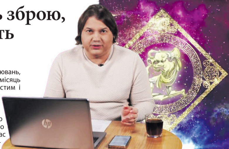
«24 лютого буде велике здивування для путіна».

Це принесе багато хвилювань, складних енергій. Цей місяць можна назвати непротим і трансформаційним. Ці періоди складно переживаються, особливо після 10 лютого. Якщо раніше Захід говорив, що не дасть зброї і схилив нас до перемир'я, то в лютому ситуація зміниться. Швидше за все, буде прийнято рішення добивати росію. Місяць буде досить-таки напруженим. Коли Марс з'єднається з Плутоном, як це було в 2022 році, почнеться новий цикл війни, буде велике протистоян-