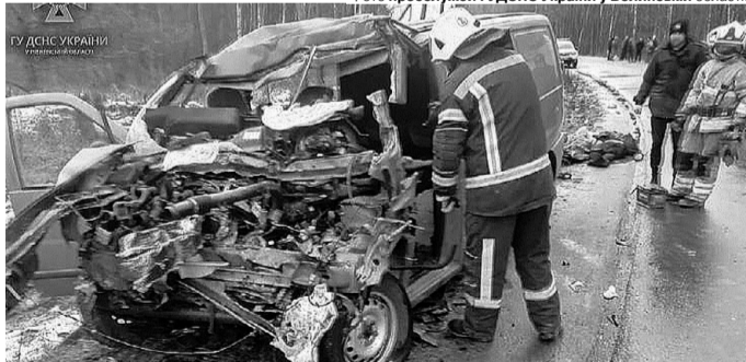
Ось що залишилося від буса після зіткнення із вантажівкою...