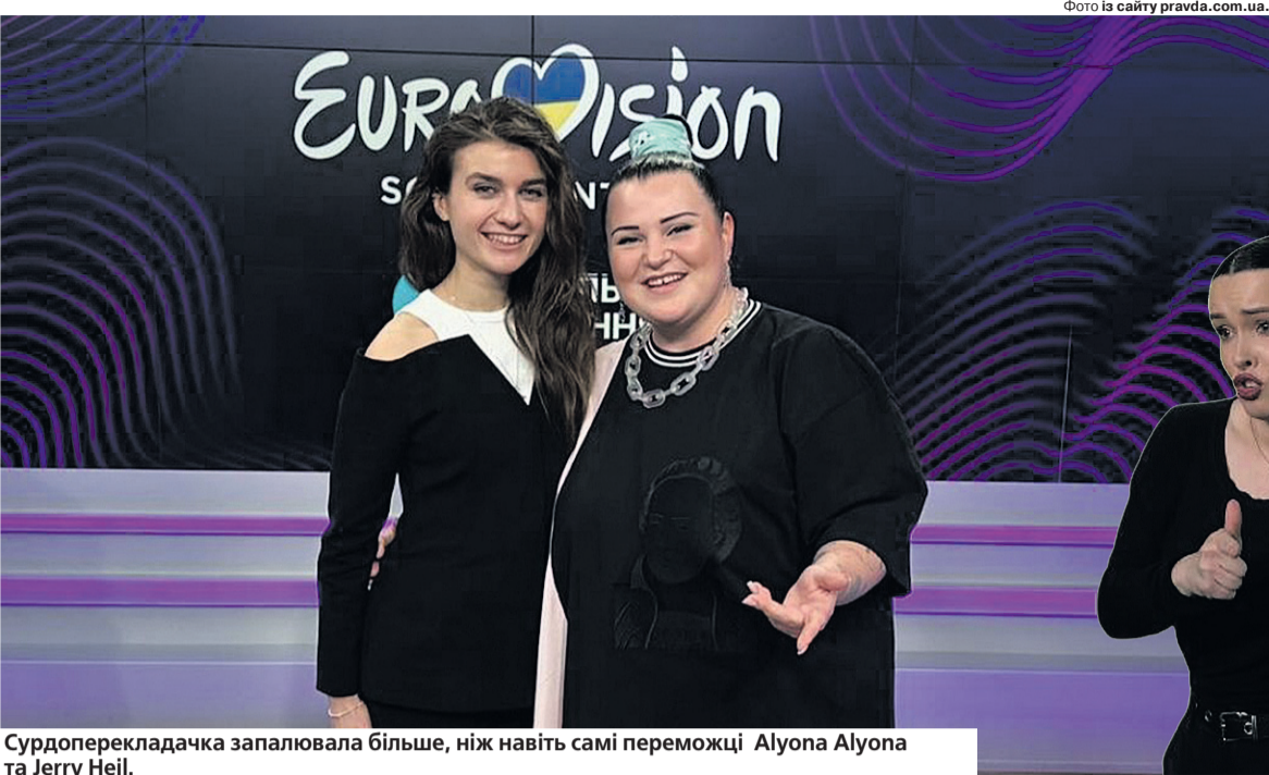
Сурдоперекладачка запалювала більше, ніж навіть самі переможці Alyona Alyona та Jerry Heil.

Свою пісню дует Jerry Heil та Alyona Alyona говорять про необхідність єднання задля добрих справ і важливих перемог. Співачки «щиро вірять в перемогу правди», однак «у світі, сповненому шуму, ми будемо почутими лише, якщо будемо об'єднаними і говоритимемо злагоджено».