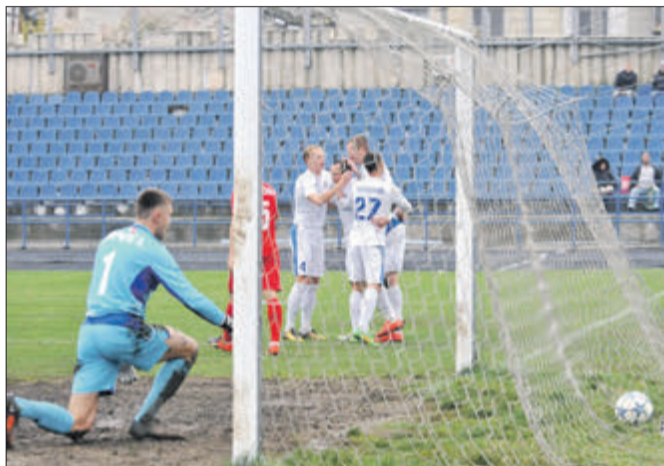
І знову м'яч у воротах лучан: таке у 22 матчах Першої ліги траплялося вже 36 разів.