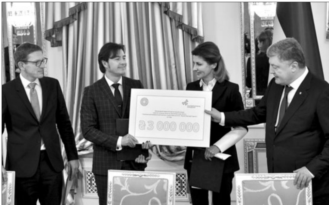
Петро Порошенко: «Хочу, щоб це був «спільний загальноукраїнський проект, а не проект одного архітектора, чи Президента, чи міністра».

На думку Петра Порошенка, надзвичайно важливо, щоб на прикладі Героїв Небесної сотні виховувалися по-