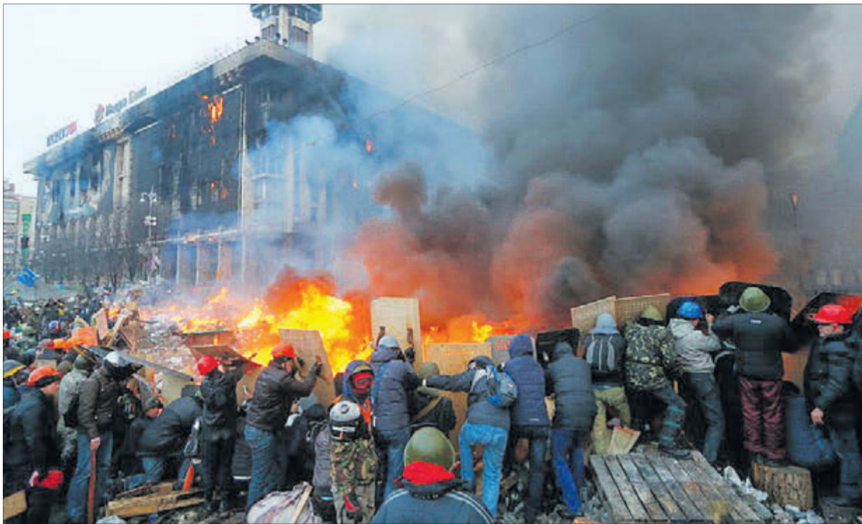
Коли проти куль — свої серця...