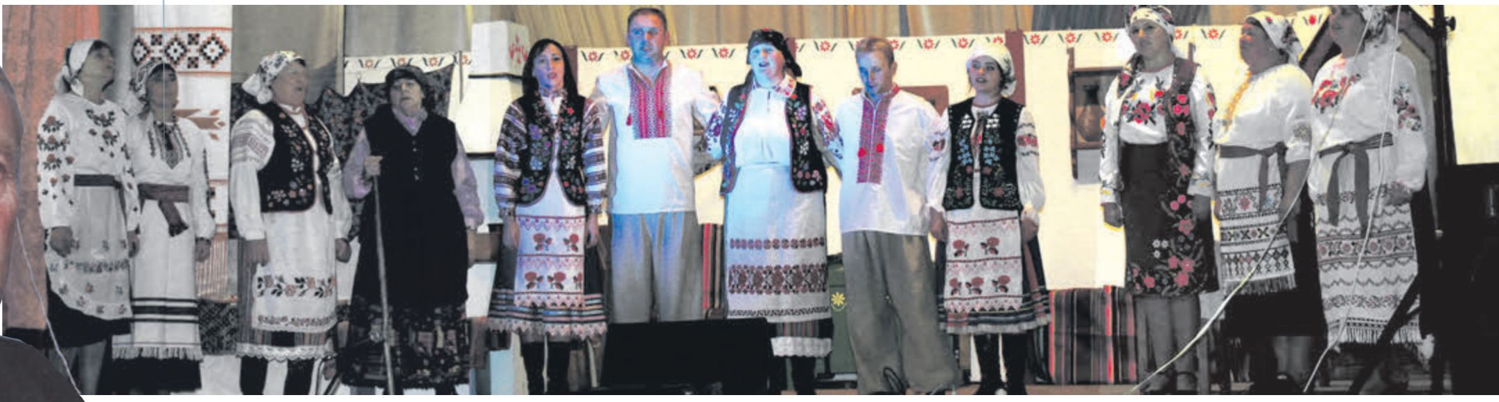
«Кайдашева сім'я» Івана Нечуя-Левицького у постановці народного аматорського театру із села Козлів Локачинського району збирає багатолюдні зали та гучні овації.