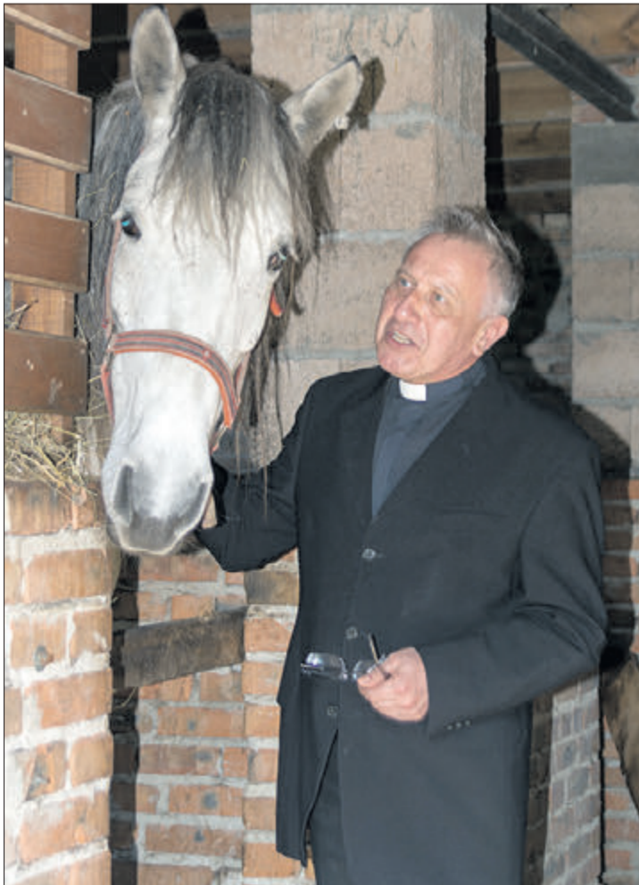
Разом із господарем чекає гостей і гриваста Аза.

Упорядкований, затишний і обжитий головний корпус незабаром задзвенить