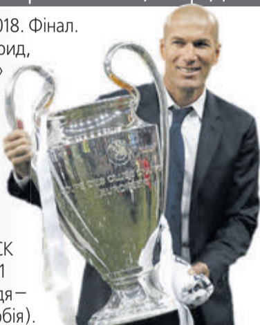
Жоден тренер до Зідана ще не виграв трічі поспіль Кубок чемпіонів.

Ліга чемпіонів 2017/2018. Фінал. «Реал Мадрид» (Мадрид, Іспанія) — «Ліверпуль» (Ліверпуль, Англія) — 3:1 (1:0 — Карім Бензема, 51 хв; 1:1 — Садіо Мане, 55 хв; 2:1 — Гарет Бейл, 64 хв; 3:1 — Гарет Бейл, 83 хв) 26 травня 2018 року. Київ. Стадіон НСК «Олімпійський». 61561 глядач. Головний суддя — Милорад Мажич (Сербія).