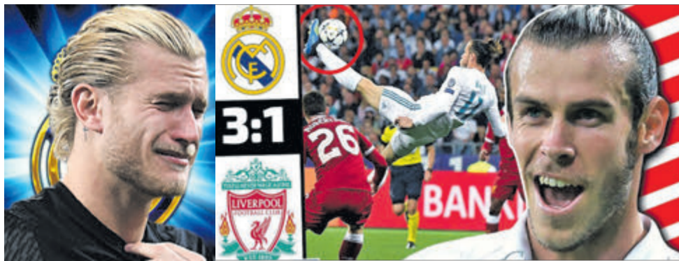
І сміх, і сльози, бо... футбол!