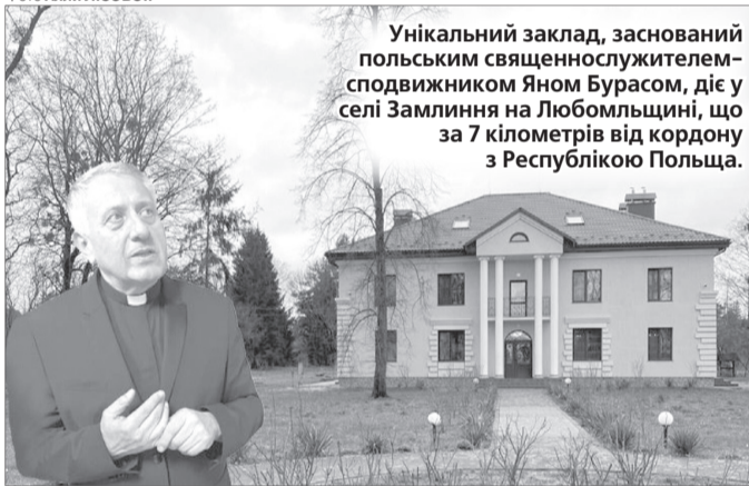
Унікальний заклад, заснований польським священнослужителем-сподвижником Яном Бурасом, діє у селі Замління на Любомльщині, що за 7 кілометрів від кордону з Республікою Польща.