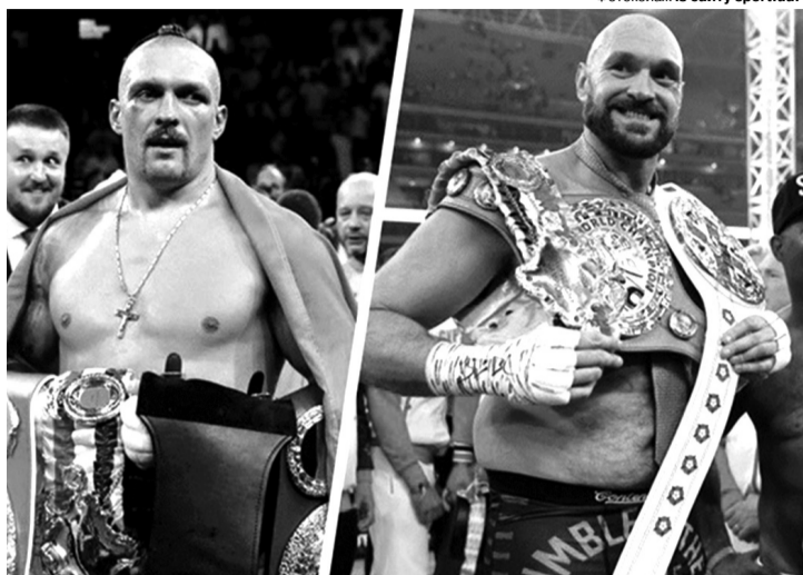
Два найкращі боксери планети зійдуться за звання абсолютного чемпіона світу в суперважкій категорії в Саудівській Аравії 18 травня.

«Я зосереджений лише на моїй підготовці, на таборі, на моїй родині та команді. Тому в цей час ніколи не використовую Instagram. Зараз це погано для мене – це трата часу. Я читаю книжки, спілкуюся з родиною. Не знаю, що відбувається поза моїм табором, домом. У мене дві книжки (у тренувальному таборі. – Ред.). Перша – це книга з психології, а друга – колишнього Президента України Кучми