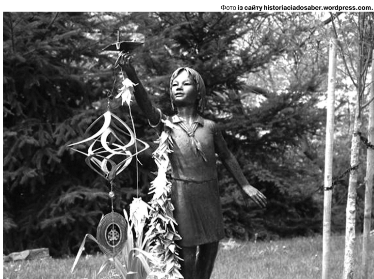
У Парку миру в Хіросімі встановлена статуя, що зображає Садако з паперовим журавликом у руці.

Справді впродовж трьох годин герої стрічки «триндіять», але, це «триндіння» – про те, що не може не зачепити. Адже йдеться про американського вченого, «батька» атомної бомби Роберта Оппенгеймера. Він очолював так званий Мангеттенський проект, що розробляв ядерну зброю. Вперше, як всі ми знаємо, атомні бомби було