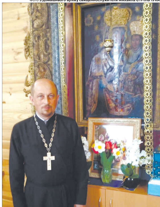
«Ми б дуже хотіли, щоб це мироточіння було знаком миру та швидкої Перемоги».