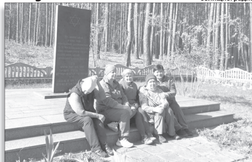
Жінки щороку наводять лад біля пам'ятника, садять і сіють квіти, за якими згодом доглядають.