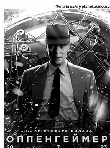
Роль Роберта Оппенгеймера зіграв ірландський актор Кілліан Мерфі.

Запам'яталася історія японської дівчинки Садако, про коротке життя якої тоді знали всі школярі. Вона народилася в