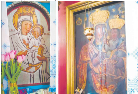
Обидва образи Діви Марії з Дитятком – старовинні, написані у сімнадцятому столітті.

«Божа роса є добрим знаком зі Святого Неба.»