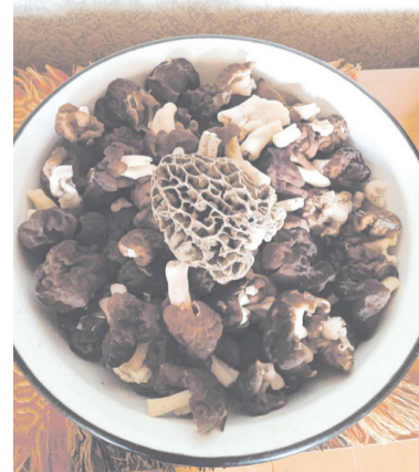
Грибочки-зморшки або ще по-народному «баранчики».

подарувала мені прогулянку лісом. Грибочки-зморшки або ще по-народному «баранчики». Майже пів відра. Теплиня...» – написала вона на своїй фейсбук-сторінці 14 квітня. ■