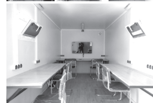
Командно-штабний комплекс складається із двох частин – штабу і зони відпочинку. Він оснащений автономним живленням, побутовою технікою і спальними місцями для екіпажу.

«Наша бригада працює на південному напрямку. Буває по-різному, залежно від погодних умов, – від 4 до 9 вильотів. Траплялося багато різних ситуацій. Нещодавно був уражений склад БК на Запорізькому напрямку. А так в основному працюємо