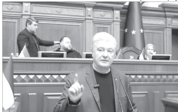
Щоб 50% силовиків, які зараз «кошмарять» бізнес, руйнують економіку, нарешті пішли на фронт».

Про це з трибуни парламенту заявив лідер партії Петро Порошенко. «Я чітко озвучив наші претензії, які роблять закон про мобілізацію надзвичайно небезпечним для країни і для армії. Декілька ключових пунктів. Перше – це відсутність чітких законодавчих гарантій своєчасного звільнення для військовослужбовців, які прослужили