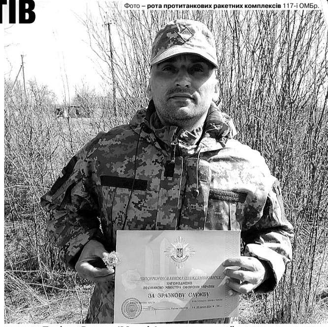
Фото – рота протитанкових ракетних комплексів 117-ї ОМБр.

16 грудня 2023 року під час виконання бойового завдання в районі населеного пункту південніше Малої Токмачки Запорізької області, з метою відтіснення сил противника, двома влучними пострілами знищив 2 розрахунки АГС противника (11 військовослужбовців). Прикривши, в свою чергу, наступаючі підрозділи бригади, які змогли закріпитись