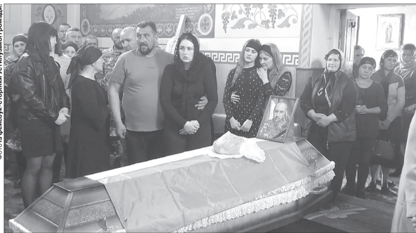
Спочатку з почестями воїна «на щиті» зустріли у Володимирі, де він багато літ працював, потім – біля його дому та у церкві села Зоря Устилузької громади, де він проживав зі своєю сім'єю...