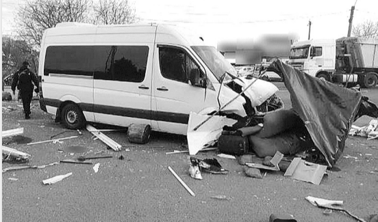
Водій заснув за кермом.