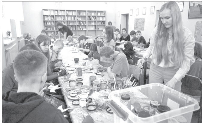
Так важливо наповнити життя радістю, любов'ю, милосердям і позитивними емоціями.

ванців центру соціально-психологічної реабілітації дітей. Їх супроводжували 15 тренерів.