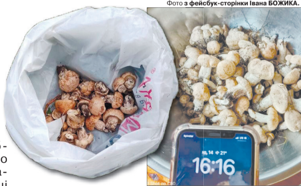
Ось на яких красенів натрапив Іван Божик.

Днями у Володимирському районі на кілька грибних краєв знайшов Іван Божик. Своїми трофе-