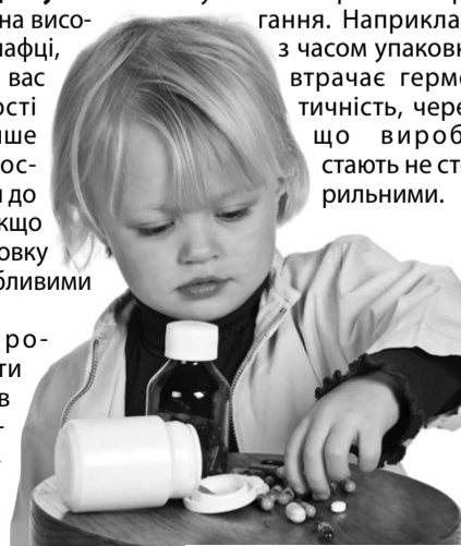
Діти в жодному разі не повинні гратися з ліками!

обхідно відрізати частину блистера або відсипати ліки з упаковки в контейнер, наприклад, у поїздку, не полінуйтеся написати назву, дату випуску та термін придатності препаратів. Рідкі та тверді ліки у флаконах потрібно тримати щільно закритими, інакше деякі препарати можуть випаровуватися, поглинати чи виділяти леткі речовини, вступати в реакцію з повітрям. Обов'язково записуйте дату відкриття флакона з ліками, це можна робити на самій коробці. Це забезпечить вас від вживання зіпсованих ліків. Не забувайте, що шприци, бинти та інші перев'язувальні матеріали також мають свої умови та терміни зберігання. Наприклад, з часом упаковка втрачає герметичність, через що виробі стають нестерильними.