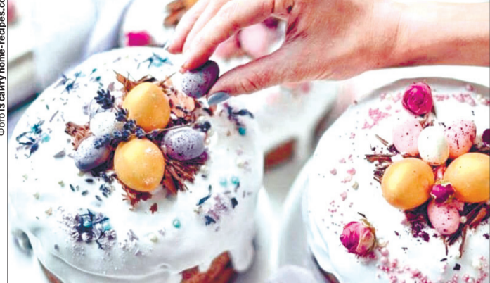
Хай сяє сонцем Великодній хліб!