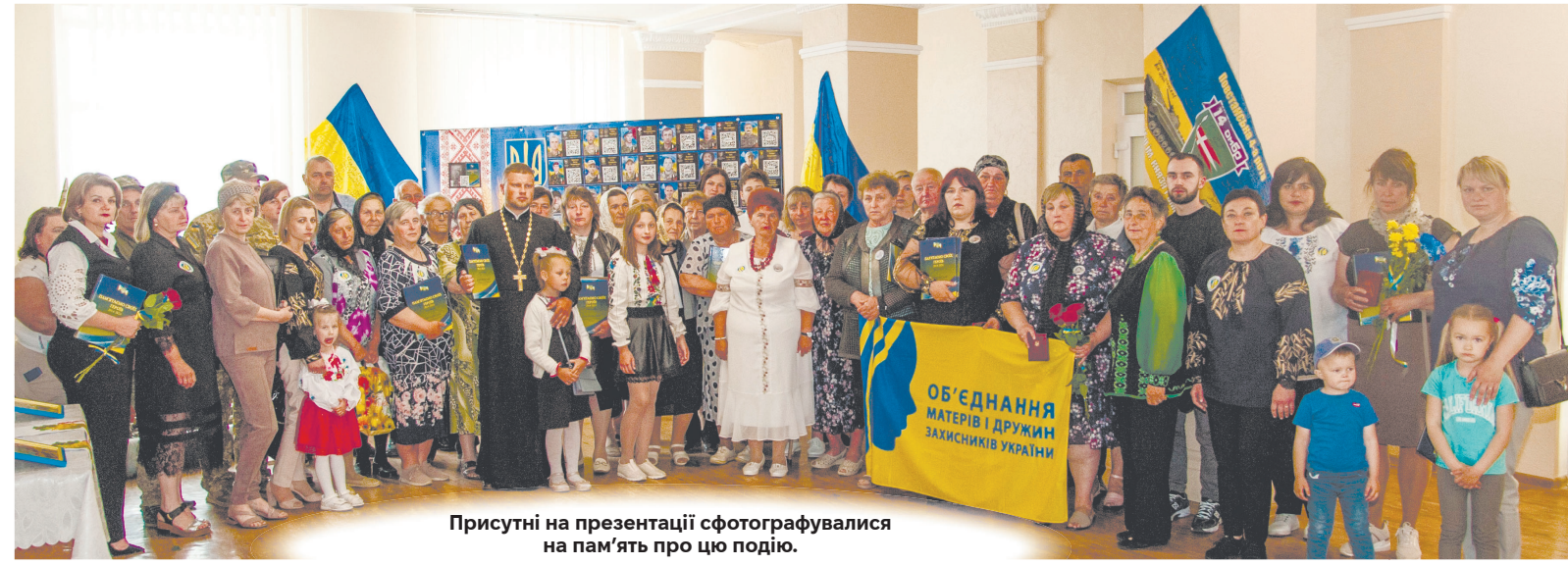
Присутні на презентації сфотографувалися на пам'ять про цю подію.