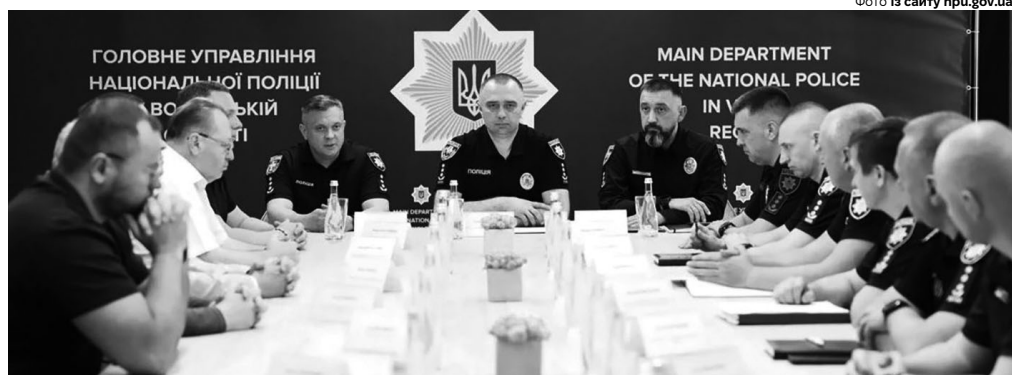
Заступник Голови Національної поліції України Геннадій Федорюк представляє нового керівника волинської поліції Олега Сліпчука (праворуч на фото).