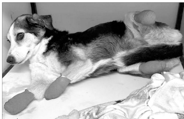
Такою знайшли вухату «дівчинку» в лісі. Тварина після пережитого до жаху боїться людей.