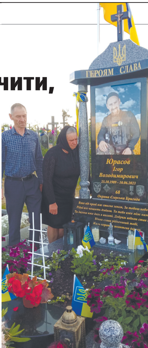
На могилі сина, куди тепер веде стежка батьків Героя.