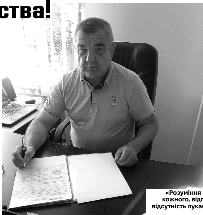
«Розуміння ситуації, індивідуальний підхід до кожного, відповідальність, а ще довіра людей і відсутність лукавства – запорука успішної праці», – вважає керівник.

– Вважаю, що згуртованість і вболівання за будь-який відрізок роботи всього