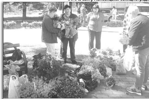
Ці ніжні квіти «кують» Перемогу!