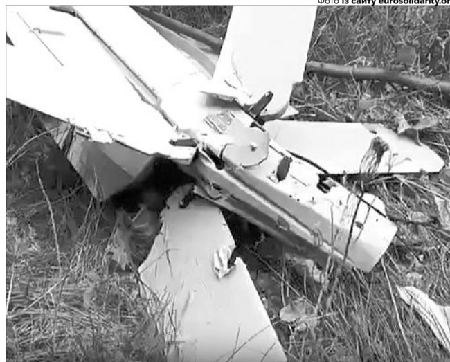
Цю «путінську пташку» назавжди приземлили за допомогою РЕБ «Ай-Петрі».

«Це не просто знищений російський «Ланцет». Поясню це відео в цифрах. Це – одна збережена українська САУшка, щонайменше п'ятеро врятованих життів екіпажу артилеристів і безліч знищених російських складів БК та одиниць важкої техніки на території РФ і на Харківщині, де зараз точаться тяжкі бої. Це відео прислали наші бійці з підрозділу «Ай-Петрі». З приміткою, що на кожному напрямку комплекс щодня душить і допомагає знищити 4 – 5 таких «пташок». Тож порахуйте його ефективність самі. Я пишаюся крутою командою, яка працює над цим інноваційним продуктом. І передаю привіт «богам війни». Скоро комплексів, які вас прикриватимуть, стане ще більше», – написав Порошенко.