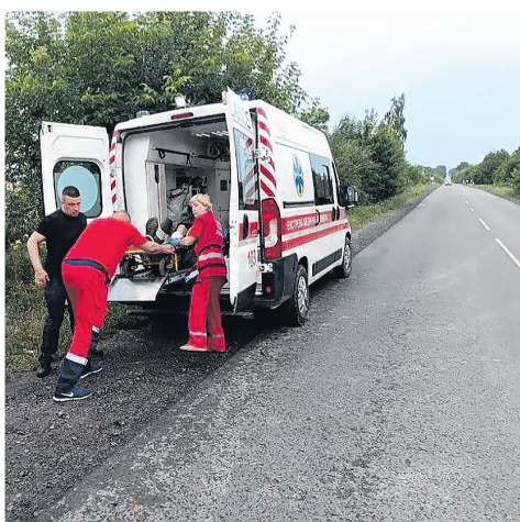
Цей випадок стався за селом Нова Лішня на Іваничівщині.

міста Нововолинськ, які виїжджали на місце пригод, пожежним автомобілем доправили хворого до карети швидкої медичної допомоги для подальшої госпіталізації. З допомогою тросу вони відбуксировали «швидку» на безпечну ділянку дороги, повідомляє пресслужба ГУ ДСНС України у Волинській області. ■