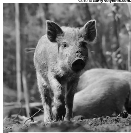
На щастя, людям ця недуга не загрожує.

Відтак, епізоотичне вогнище – територія Борового лісництва – визнана неблагополучним пунктом, а навколо нього, в радіусі до 3 кілометрів, вста-