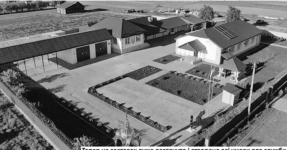
Тепер на заставах дуже доглянуто і створено всі умови для служби.