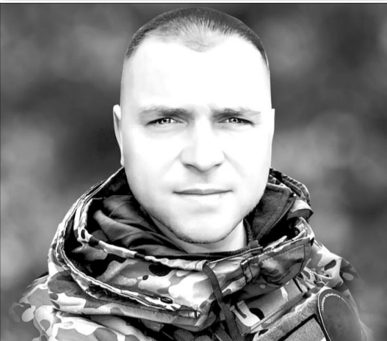
Таким Герой увійшов у Вічність...