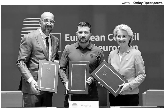
Шарль Мішель, Володимир Зеленський і Урсула фон дер Ляєн під час підписання угоди.

ського вторгнення. У червні того ж року Європейська рада надала нашій державі статус кандидата на вступ, а торік у грудні Європейський Союз ухвалив рішення про відкриття переговорів з Україною. Менш ніж за два роки, 21 червня 2024 року, Євросоюз затвердив пере-