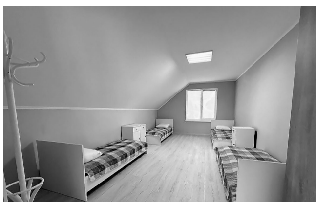
Ще донедавна прикордонники про таку «казарму» могли тільки помріяти.

«Для проживання та відпочинку персоналу на одному з підрозділів облаштували модульне містечко.»