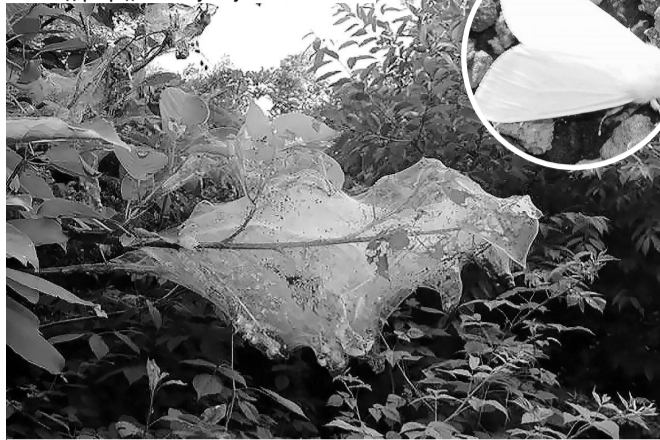
Незважаючи на зовнішню красу нічного метелика, це надзвичайно агресивний шкідник.