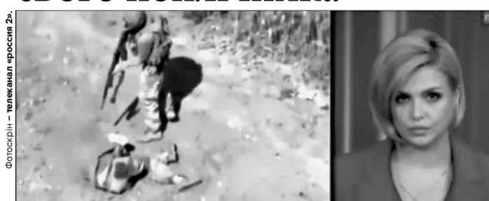
«Ставлення до своїх же побратимів, як до комах-шкідників», – зазначила російська телеведуча, не підозрюючи, дає неймовірно точну характеристику російським військовим.

На них видно, як групу окупантів у Запорізькій області атакує український FPV-дрон, унаслідок чого один із них от-