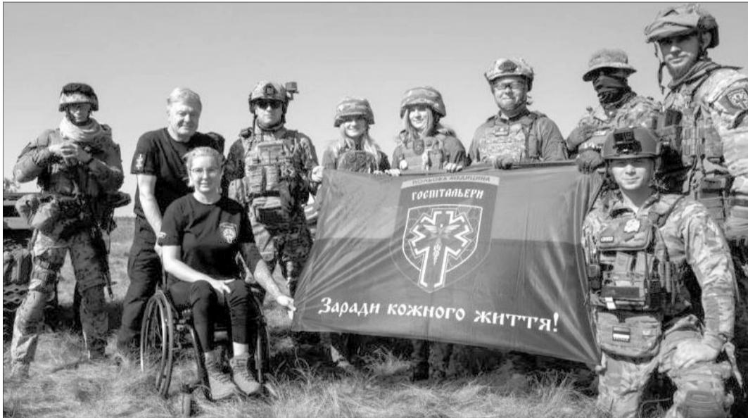
П'ятий президент України Петро Порошенко разом із народною депутаткою Яною Зінкевич у гостях у команди медичного батальйону «Госпітальєри».

Він нагадав, що від початку російської агресії на Сході України військових медиків катастрофічно бракувало, але треба було рятувати хлопців.