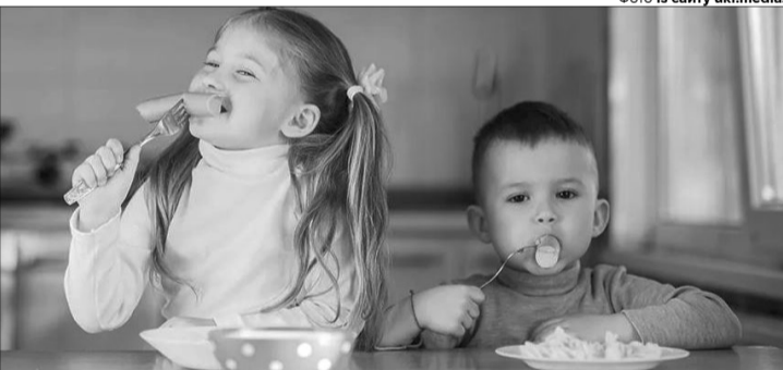
Сосиски не можна давати малюкам до 6 років!