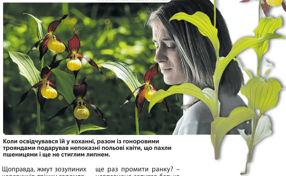
Коли освідчувався їй у коханні, разом із гоноровими трояндами подарував непоказні польові квіти, що пахли пшеницями і ще не стиглим липнем.