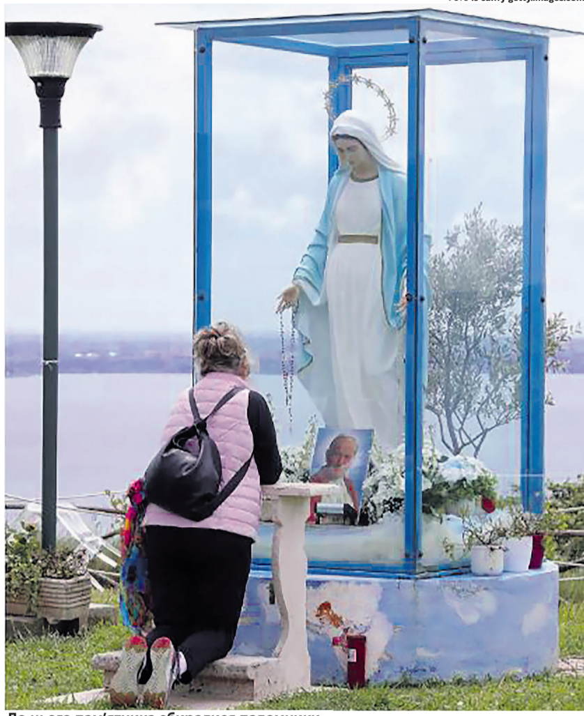
До цього пам'ятника збиралися паломники з багатьох куточків світу.

Але минулого року місцеві жителі з маленького містечка Тревіньяно Романо, які скептично ставилися до кровоточивої статуї, викликали приватного детектива. Після цього стало відомо, що червона рідина, яка виділяється з очей статуї, була... свинячою кров'ю.