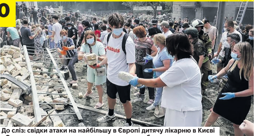
До сліз: свідки атаки на найбільшу в Європі дитячу лікарню в Києві «Охматдит» допомагають рятувальникам розбирати завали.

Роман МЕЛЬНИЧЕНКО, психолог, експерт зі стосунків, nv.ua