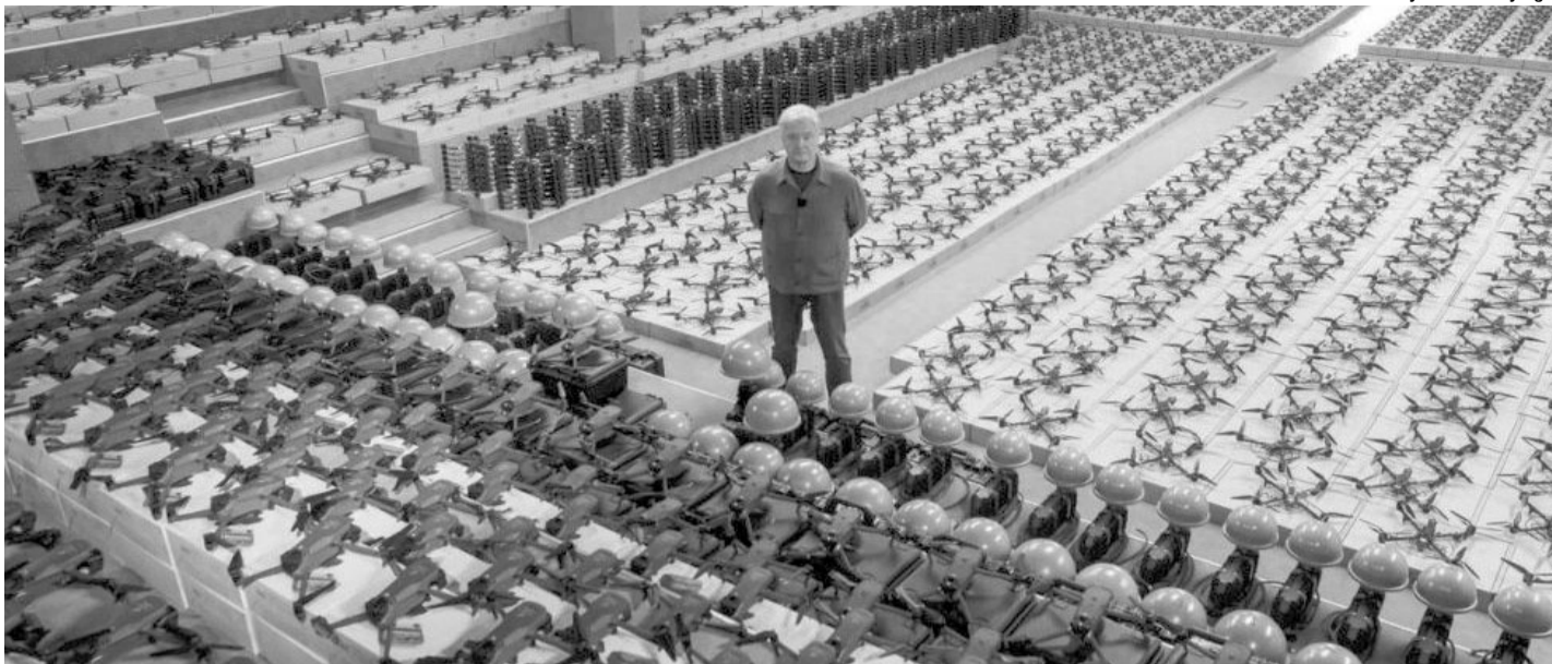
Виглядає вражаюче! І скільки москалів покладуть ці «кусючі пташки»!