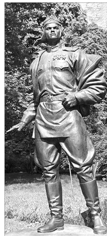
Пам'ятник Івану Микитовичу у Києві.

У 1945-му в небі над Берліном із асом трапився не надто приємний інцидент: він збив два американські винищувачі, пілоти яких першими напали на Кожедуба, сприйнявши його за фашиста.