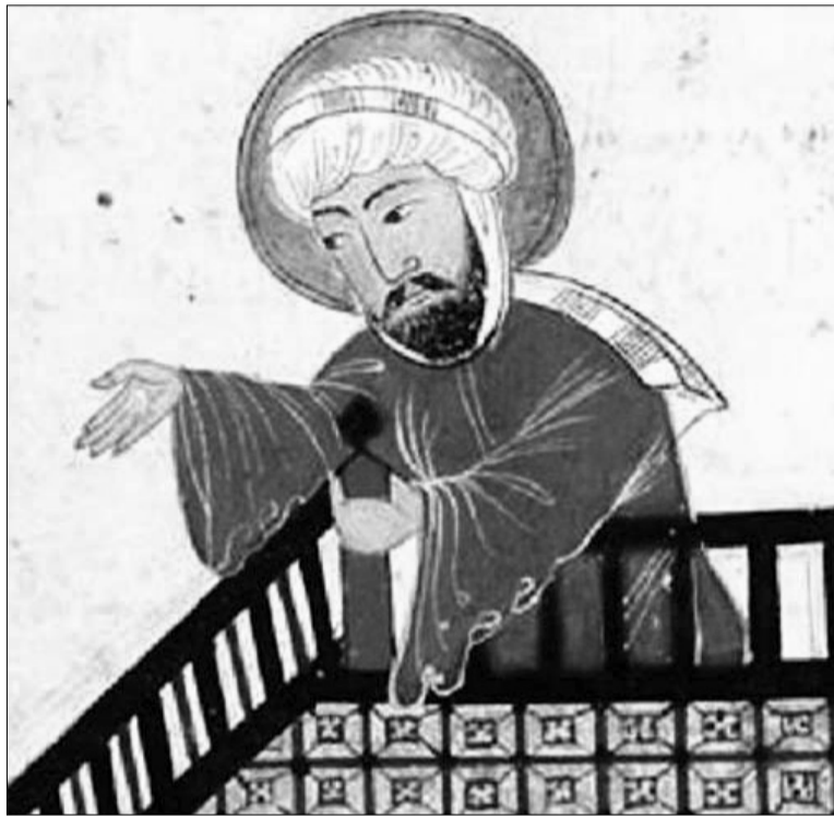
Проповіді Вчителя збирали величезні натовпи.