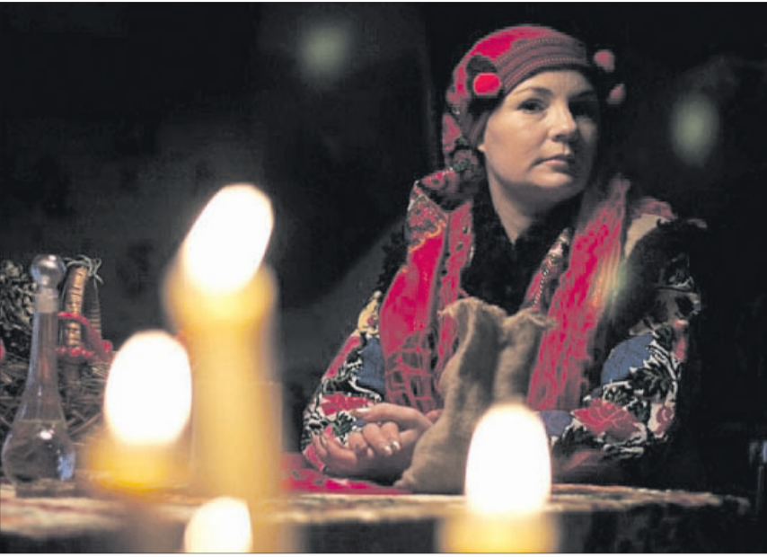
«Щоб поновити сили, мушу зануритися в гірську річку, побути наодинці з природою-матінкою».