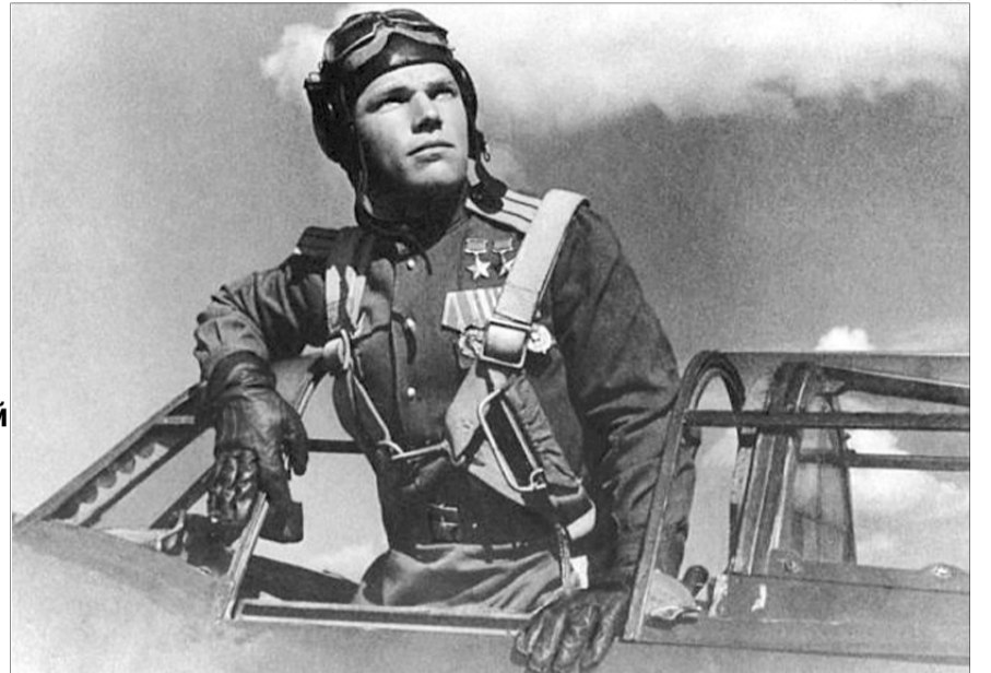
Знаменитий ас постійно наголошував: «Хоробрість без гарту — холодний постріл».