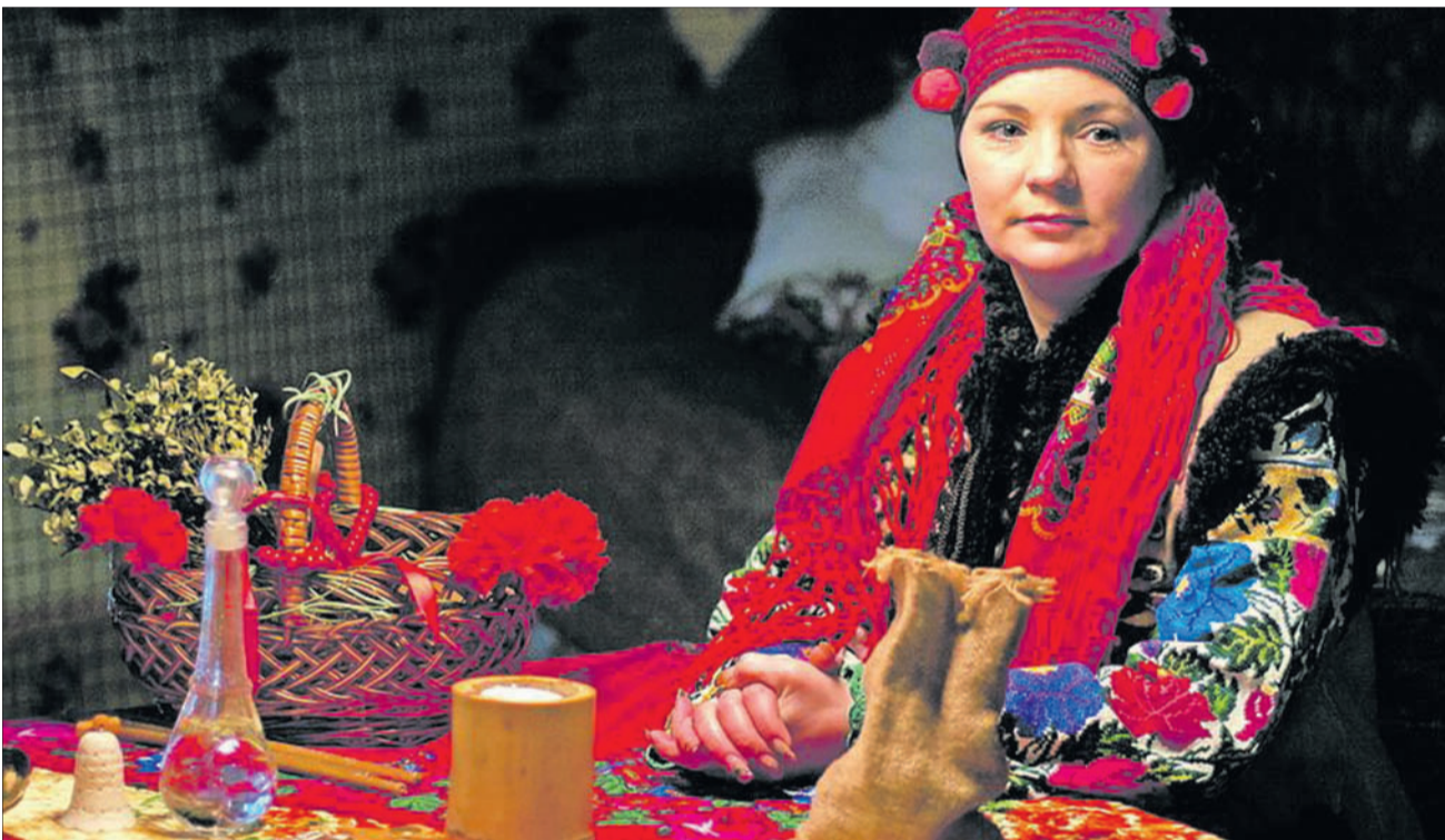
«Дар цілительства перейняла від бабусі...»