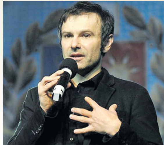
«Ти не можеш зробити світ праведним, не будучи сам праведним».

Лідер культового рок-гурту «Океан Ельзи» радить співвітчизникам не перекидати всю провину на політиків, а поглянути на себе. Про це він заявив в інтерв'ю журналу «Elle»