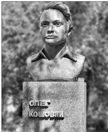
Варіації пам'ятників Олегу Кошовому були чи не в кожному місті Радянського Союзу.

Звісно, ніхто не сумнівається в існуванні «Молодої гвардії». Справді, організація була, як уміла і могла, боролася за своє місто. А як уміла? Там не було ані фахових військово-