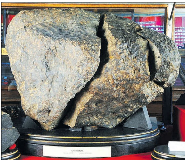
Уламки метеорита стали експонатами музею.

9 червня 1866 року приблизно о 17-й годині у небі над тодішньою Австро-Угорщиною з'явилася вогняна куля. Зі свистом подолавши 220 кілометрів, вона, за спогадами очевидців, вибухнула, розсипавшись на тисячі дрібних камінців. Звук був наче від залпу сотні гармат, а уламки накрили територію радіусом майже 7 кілометрів. Утворилася чорна хмара з різким запахом сірки, яка протрималася близько 15 хвилин. Сталося це неподалік села Княгиня комітату Унг Угорського Королівства, а нині Великоберезнянського району Закарпатської області. Можна лише уявити реакцію місцевих жителів, які, напевно, хрестячись, зі страхом дивилися на небо. Однак пройшло трохи часу — кам'яний дощ припинився, пилюка вляглася і життя пішло своєю чергою.