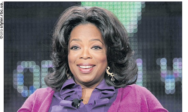
Через терни до зірок — таким був шлях Опри Вінфрі.

Аж ось отримую редакційне завдання до Дня журналіста — стаття про Вінфрі і Мазур, двох відомих телеведучих, американку та українку. Обидві красуні, професіонали й обидві вмють передавати співчуття і любов до людей через екран. Одна — експресивна і відкрита, друга — спокійна і стримана. Позаду у кожній — дуже різні дороги.