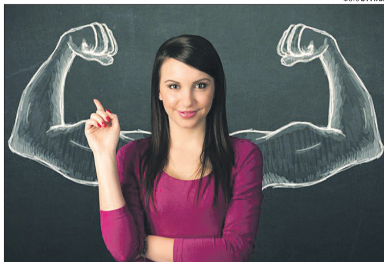
«Якщо я роблю щось для когось — то це не зі страху, а з любові. Це мій вибір».

Мені набридло вибудовувати шикарний фасад і витрачати величезні сили на його підтримку. Дехто думає, що моє життя ідеальне,