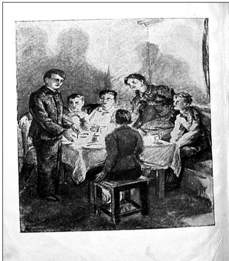
А ви читали «Молоду гвардію»?