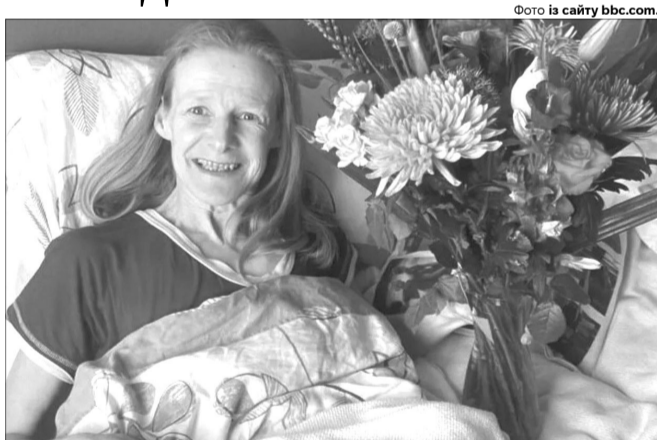
Едіна добровільно пішла з життя в оточенні близьких родичів.

Жінка розкрила причину свого рішення піти з життя шляхом евтаназії у несамовитому прощальному слові