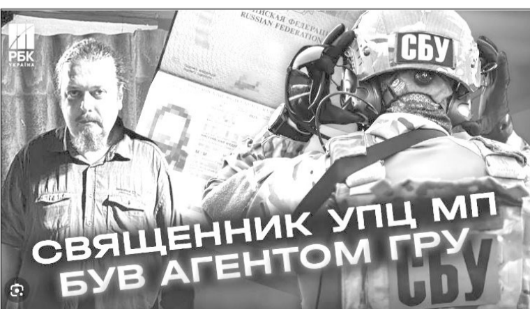
Найстрашніше, що цей колаборант знає: йому нічого не буде, бо обміняють на українського полоненого.

Під час дистанційного контакту російський куратор доручив кліри-