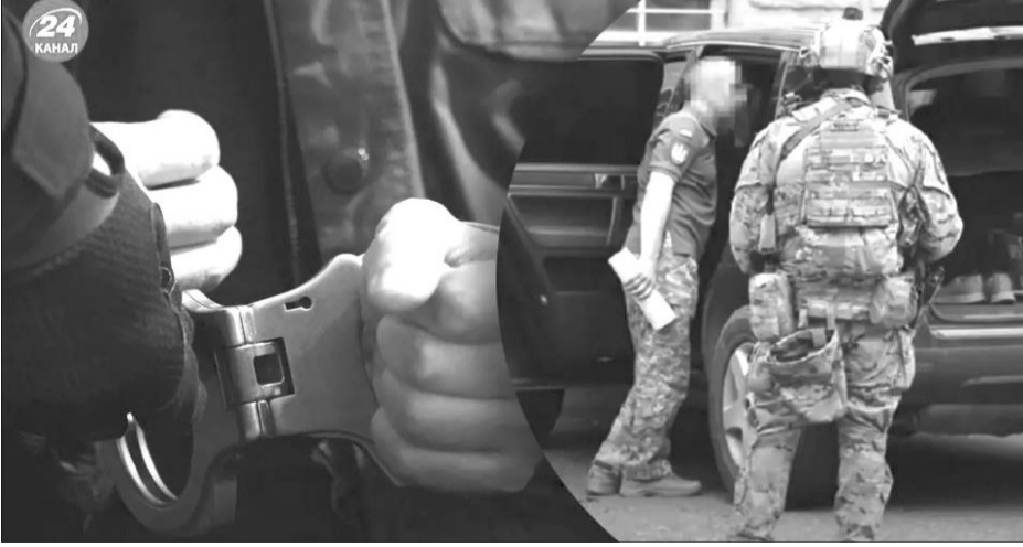
За даними поліції, за місяць «воєнкоми» заробляли до 150 тисяч доларів.

До злочинної групи входив також колишній начальник ТЦК Борщева, що на Тернопільщині, який наразі працює в міській раді