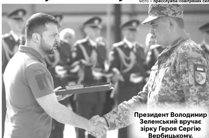
Президент Володимир Зеленський вручає зірку Героя Сергію Вербицькому.

Далі вони вже порозумнішали, зробили висновки, почали переміщення робити більш обережно, невеликими коло-