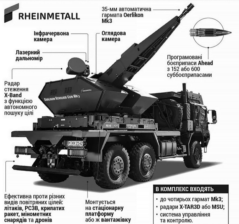
Коштує один такий комплекс 90,5 мільйона доларів.