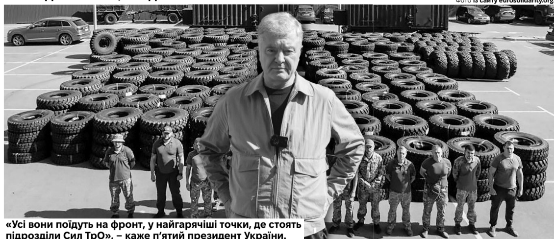
«Усі вони поїдуть на фронт, у найгарячіші точки, де стоять підрозділи Сил ТрО», – каже п'ятий президент України.