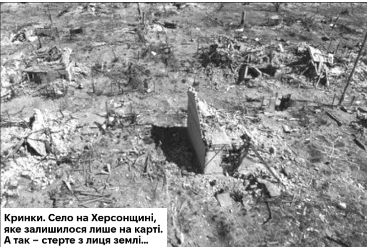
Кринки. Село на Херсонщині, яке залишилося лише на карті. А так – стерте з лиця землі...