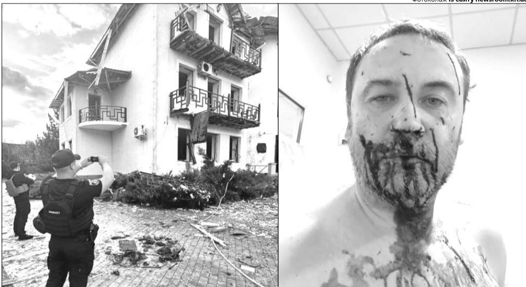
Опозиційний росіянин після атаки зазнав осколкових поранень.

Про удар по його будинку «Шахедами» Ілля Пономарьов також підтвердив у дописі на своїй сторінці у соцмережі. Російський опозиціонер написав, що це ще один день його народження. «П'ята спроба нападу була найбільш нещадною та успішною, проти якої було важко захиститися. Але дзуські їм!», – зазначив Пономарьов.