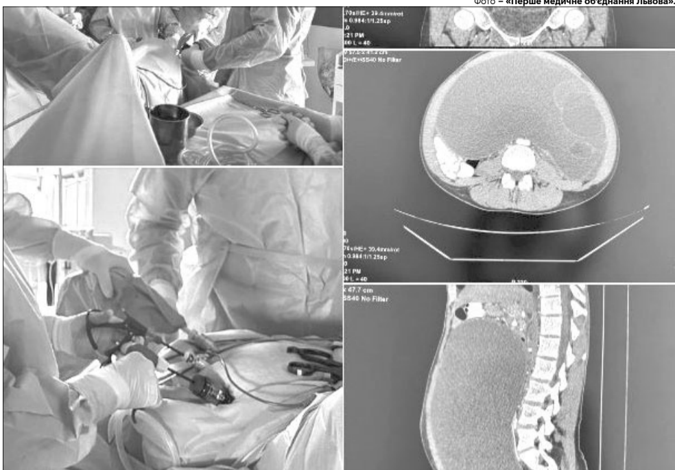
Величезний новоутвір видалили без розтину черевної порожнини.

Молоду жінку з велетенською кістою яєчника прооперували гінекологи Лікарні Святого Пантелеймона «Першого медоб'єднання Львова». Вони змогли успішно видалити гігантське утворення – довжиною у чверть метра – через три невеликі розрізи по 1,5 см, без розтину черевної порожнини