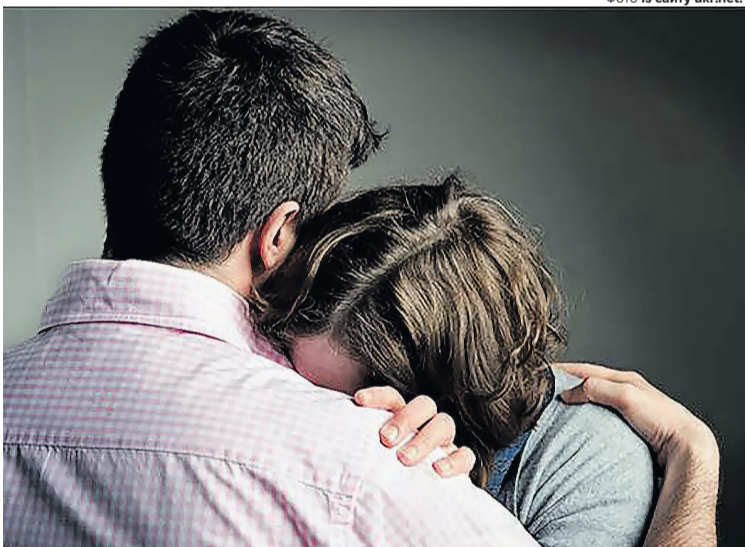
«Це був удар не лише по обличчі, а й – по душі».