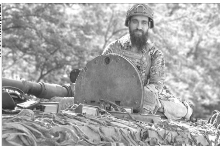
«Для мене кожен клаптик землі – святий, він на сьогодні – політий кров'ю наших побратимів, посестер і цивільних людей.»

є, – це бажання захистити свою країну й вигнати ворога звідси. Кожен клаптик землі – святий, він на сьогодні – політий кров'ю наших побратимів, посестер і цивільних людей.