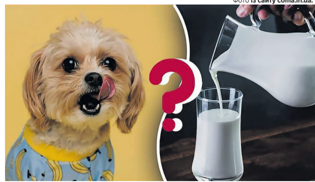
«Рексик, тобі не можна. Це для Мурчика!».