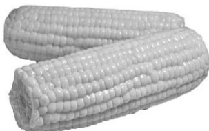
Запам'ятайте: не досолойте окріп!

Час її приготування зазвичай становить 10 – 15 хвилин (під кришкою) з моменту закипання, але може змінюватися, залежно від розміру і кількості качанів