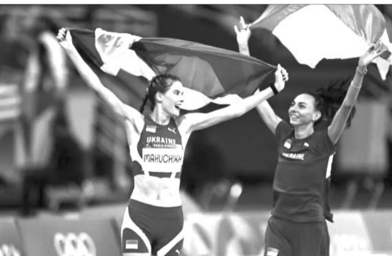
Фантастика: двоє українок у стрибках у висоту ще не були на п'єдесталах Олімпіад!