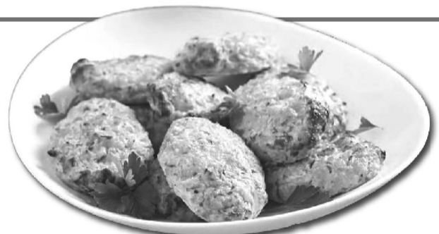
Справді, пальчики оближеш!

Приготування: 1. Кабачки помийте та почистіть. Один нарежьте пластинками, посоліть, поперчіть з двох сторін і залиште на 15 – 20 хвилин. 2. Другий кабачок натріть на середню терку, посоліть і також залиште на 15 – 20 хвилин. 3. Яйця вбийте в глибоку