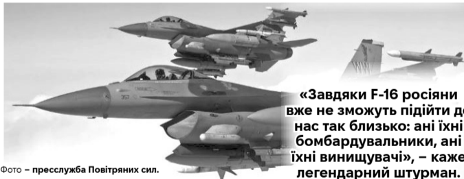
«Завдяки F-16 росіяни вже не зможуть підійти до нас так близько: ані їхні бомбардувальники, ані їхні винищувачі», – каже легендарний штурман.

нами. Були готові, що авіація може в будь-яку хвилину завдати удару. У нас збільшилися втрати екіпажів...»