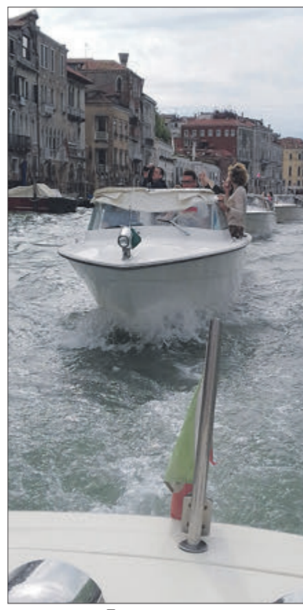
Прогулянка на водному таксі.