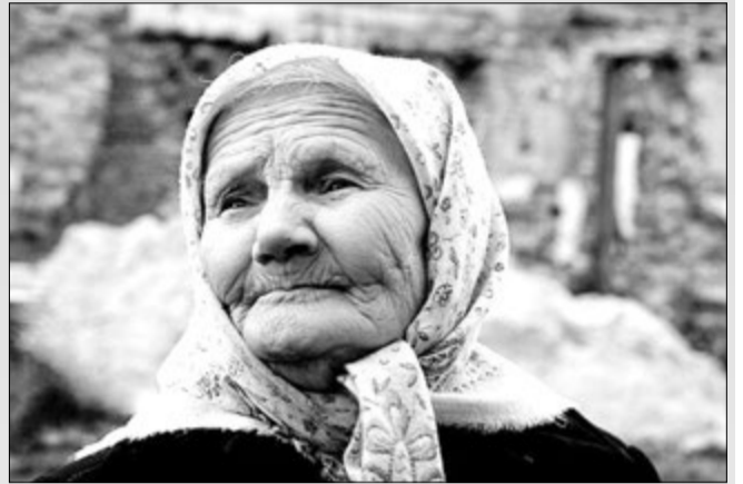
Життя прожити — не дощову годину перечекати.