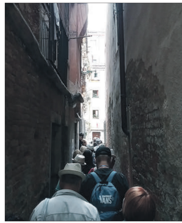
Ось такими лабіринтами пробираються туристи.