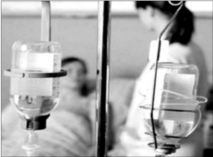
«Прокапування» не має жодних науково доведених переваг у профілактиці інсульту і не рекомендоване для використання у розвинених країнах.

ратів, які при інсульті широко використовуються в Україні і вводяться за допомогою крапельниць (ліки для «захисту», «лікування» чи «відновлення» мозку, так звані нейропротектори, «судинні препарати», антиоксиданти, антигіпоксанти тощо), не мають науково доведеної безпечності та ефективності і не застосовуються для