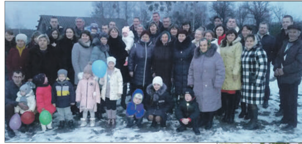
На 70-річчя до рідної людини зібралась величезна родина.