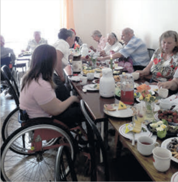
Тут збираються ті, кого рідко запрошують в гості.