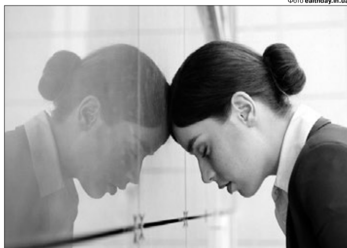
А лікарі кажуть: «Здорова!»

Найпростіше для лікаря поставити діагноз «вегето-