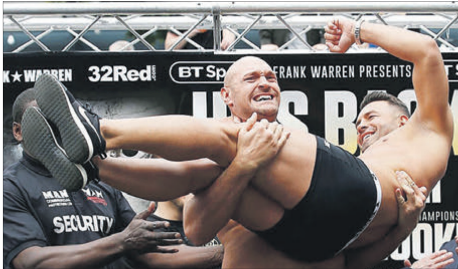
Тайсон Ф'юрі — Сеферу Сефері: «Я ж тебе, «милая», аж до... рингу сам на руках донесу. І поб'ю!»