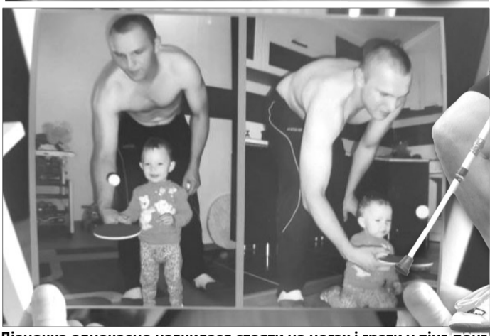
Діаночка одночасно навчилася стояти на ногах і грати у пінг-понг.

партіях зміг дотиснути китайця і виграти – 3:2!