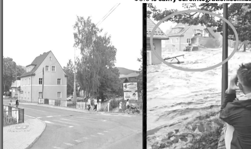
Будинок у Строне-Шльонській: до і після прориву дамби.