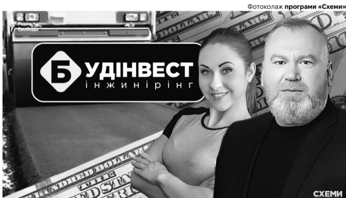
Журналісти програми «Схеми» встановили документальні докази прямого зв'язку між Валентином Резніченком та Яною Хлантаю.

Окрім очільника ОВА, правоохоронці повідомили про підоз-