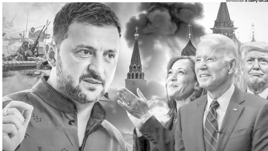
Президент України представить стратегію перемоги над росією першим людям США.

Чотири пункти є основними, ще один потрібен для післявоєнного часу