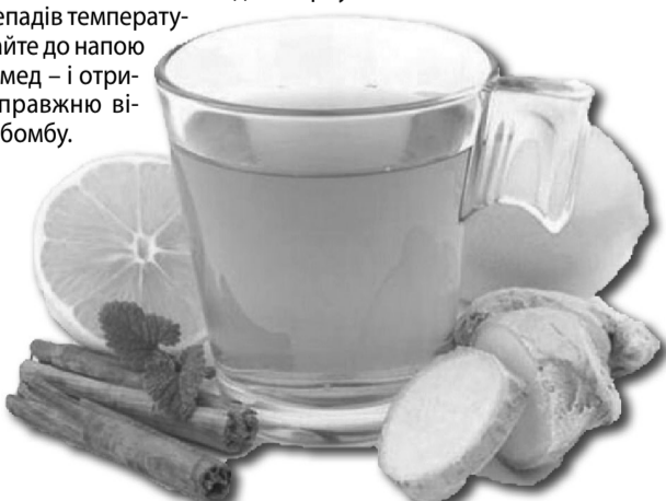
Додайте до імбирного чаю лимон і мед – і отримаєте справжню вітамінну бомбу.

Щоб не захворіти через перепади температур, пийте ці напої щоденно і дотримуйтеся правильного раціону харчування.