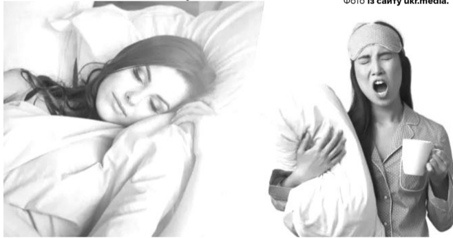
Хочете добре спати? Забудьте про вечірні каву і шоколад!