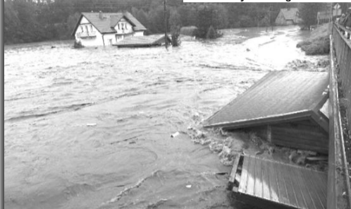
Нинішню повінь у Польщі називають найсильнішою з 1997 року.