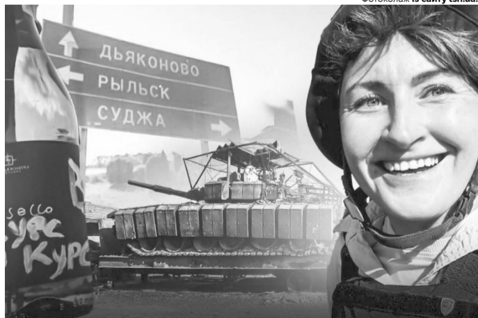
«Місцеві казали, що треба розстріляти їхнього губернатора, бо він їх кинув. Натомість путін, за їхніми словами, просто не знав, що тут робиться».

«У мене не було радості від того, що я ступила на російську землю. У нас просто немає гена окупанта... У нашому репортажі був яскравий кадр, коли наші військові скидають прапор росії. У цей момент я усвідомлювала, що начебто страшна росія, якою