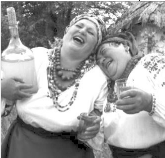
Цікаво, чи заспівають литовці і литовки після трьох чарок українською: «Ой, хто п'є, тому наливайте...?»