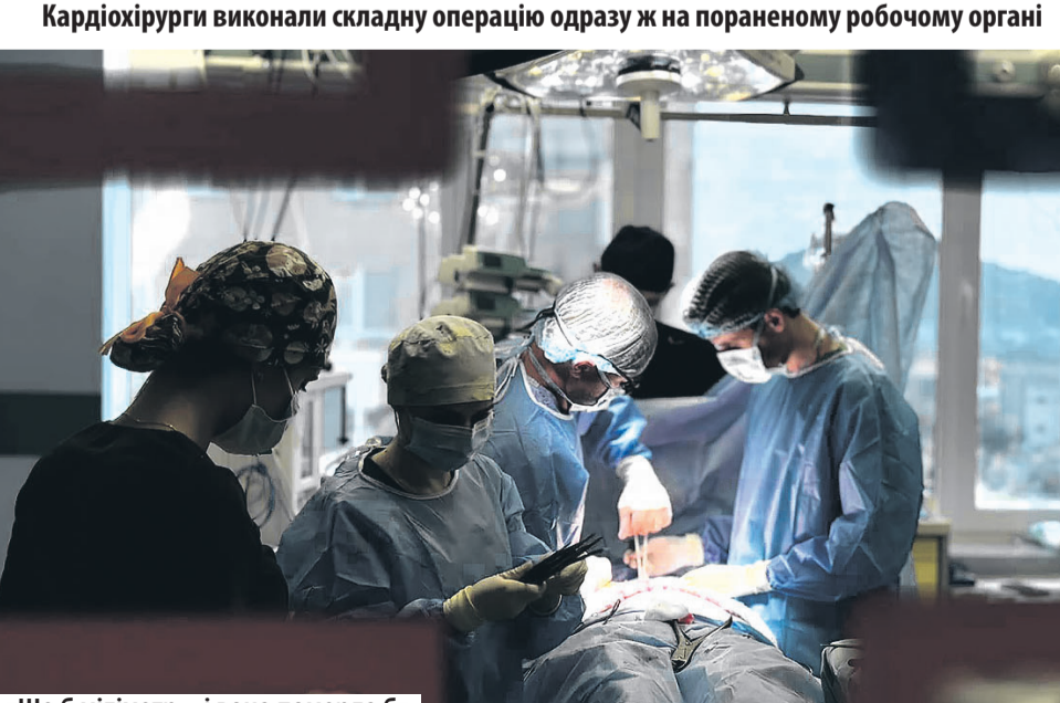
«Ще 6 міліметр – і вона померла б».

Ліа ЛІС Це відбулося в Лікарні Святого Пантелеймона «Першого медоб'єднання Львова». 22-річну львів'янку, в серце якої потрапив уламок, вже виписали з лікарні. Рівно за тиждень після трагічного масованого ракетного удару по Львову 4 вересня. На порятунк цієї критичної пацієнтки у медиків було обмаль часу! Кардіохірурги Центру серця та судин Лікарні Святого Пантелеймона «Першого медоб'єднання Львова» змогли оперативно витягти осколок та врятувати життя дівчини.