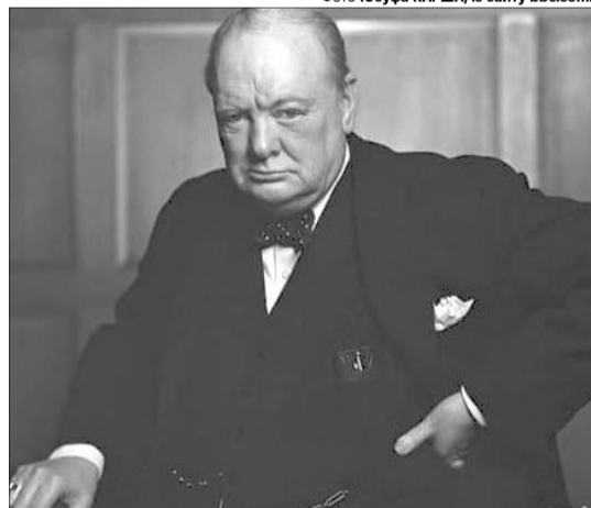
«Лев, що реве». Фотограф Юсуф Карш каже, що так назвав цю світліну, адже в цей момент Вінстон Черчилль виглядав «таким войовничим, що міг би мене зжертви».

Йдеться про оригінал відомої фотографії британського прем'єра, який кілька років тому зник із готелю в Оттаві та був замінений на підробку