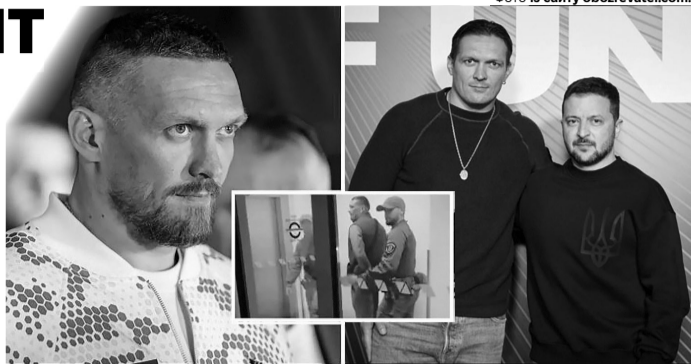
«Володимире Олександровичу, дякую вам особисто».

17 вересня, чемпіона світу з боксу в суперважкій вазі Олександра Усика затримали в аеропорту Кракова