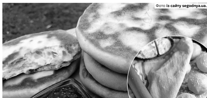
Такі оципки підходять як до перших страв, так і на десерт із варенням чи медом.

1. Кефір з'єднати з сіллю, цукром та содою. Добре перемішати.