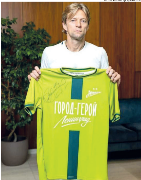
Один із відгуків на цю фотографію на сайті sport.ua: «Манкурт ср'їний не спромігся українцям допомогти, які від москальських обстрілів страждають, а москалям дупу вилізує. Істинний «хахоль», а не українець».

Зазначимо, що наразі 45-річний українець працює помічником тренера у Санкт-Петербурзі-