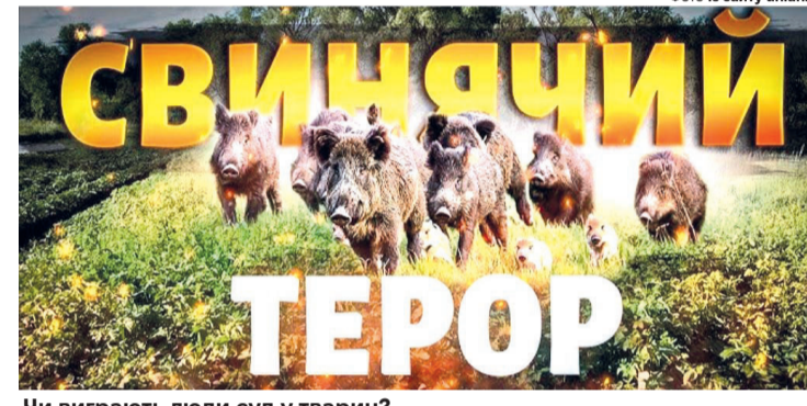
Чи виграють люди суд у тварин?

Ці тварини гуртуються у великі групи та поїдають усе на своєму шляху, завдаючи значних збитків мешканцям села. За словами копилівчан, свині належали місцевому жителю, який покинув поселення, випустивши своїх тварин на волю. Тепер серед