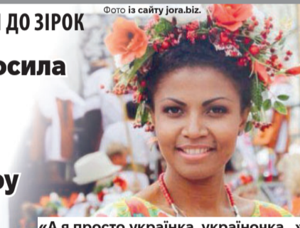
«А я просто українка, україночка...».

Бабуся просила в голови колгоспу захистити чорношкіру онуку