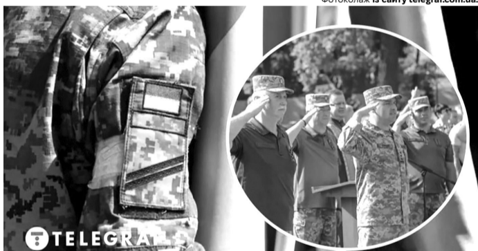
У разі мобілізації пенсіонерів військових та силових структур пенсію їм зберігатимуть.

«На сьогодні жодних проблем із мобілізацією військових пенсіонерів та пенсіонерів силових структур немає. Військові пенсіонери підлягають мобілізації на загальних засадах до досягнення 60-річного віку. А після набуття чинності ухваленого нами закону