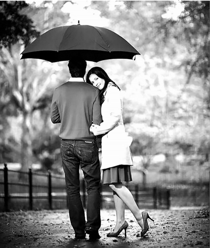
«Ти казала, що любила танцювати під осіннім дощем. Спробуємо?..».