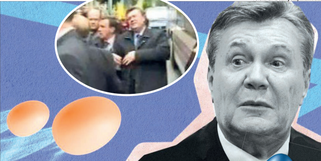
Фотоколаж із сайту suspilne.media.