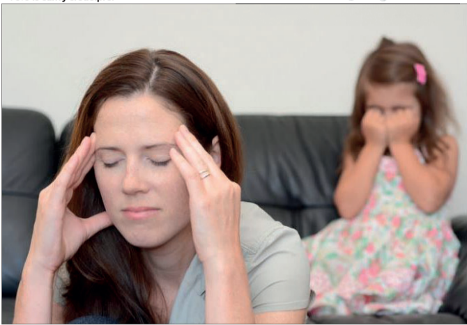
«Ти забув, що я доньку до садка воджу і забираю. Ходжу в магазин, готую...».