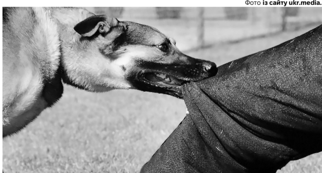
Собаки та будь-які інші бродячі тварини після укусу через слину можуть заразити людину смертельною хворобою – сказом.

Будьте уважні та обережні при можливих зустрічах з бродячими псами, адже вони можуть на вас напасти