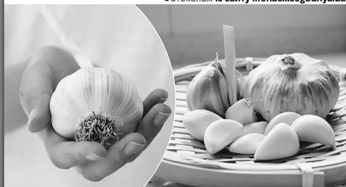
І зубчики чисті, і руки – не пахнуть...