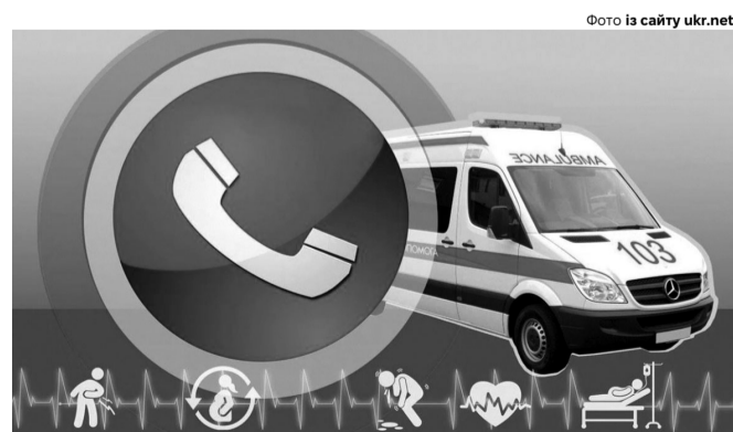
Це – вже 58-ма успішна серцево-легеневу реанімація на Волині з початку цього року.

Як пише Волинський обласний центр екстреної ме-