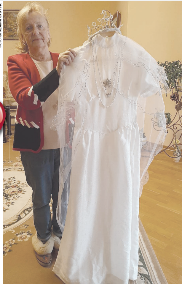
Уже реліквією стала і сукня, яку колись пошила внуччі бабуня, і весільні прикраси нареченої.

Репортаж із дому, де живе любов, – на с. 9