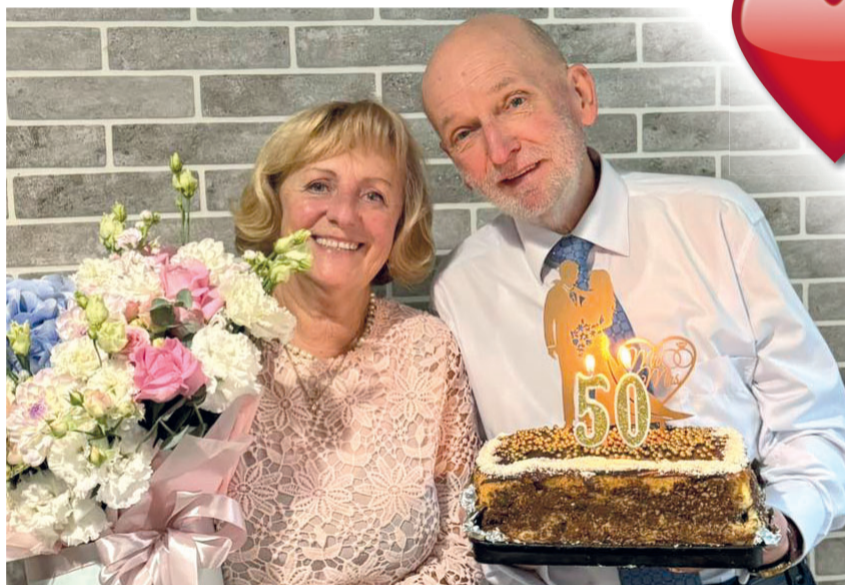
Яке це щастя, що я з тобою одружився! – мабуть, кожна жінка хотіла б почути такі слова від чоловіка через пів століття шлюбу.

Відомий усім політик нашого краю Володимир Банад багато років працював на Луцькому автомобільному заводі, був заступником голови Луцького міськвиконкому, Волинської обласної ради, начальником управління житлово-комунального господарства облдержадміністрації. Він стояв біля витоків боротьби за незалежність України, очолюючи понад чотирнадцять років Волинську крайову організацію НРУ. Тобто – людина знана як активний громадський діяч. А яким є його особисте життя? Хто та жінка, яка завжди – поряд із ним? Про це ми й розпитували, потрапивши, з дозволу весільних ювілярів, за лаштунки їхнього приватного життя