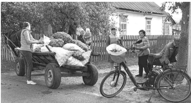
Як у старій-добрій притчі: «Хто чим багатий, той тим і ділиться...».

Ще й поділилися овочами із закладом у Чарторійську