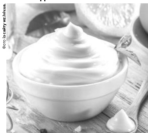
І смачно, і корисно!