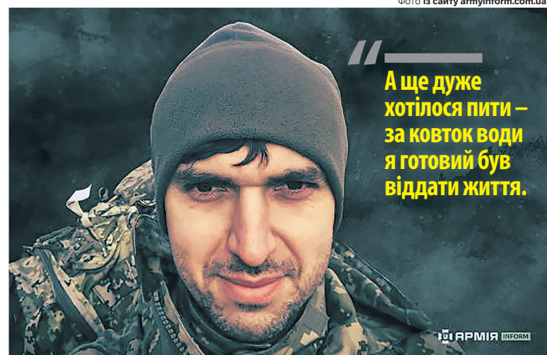
«А ще дуже хотілося пити – за ковток води я готовий був віддати життя.»

Через потужний обстріл, що вели по нас орки, товариші, які намагалися dopravити мене до тилу, вимушені були залишити мене в