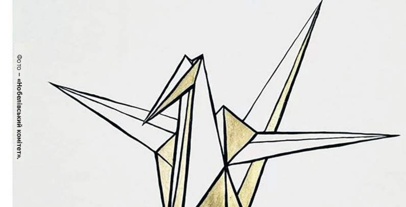
«Зусилля для світу без ядерної зброї», – гасло нобелівських лауреатів в галузі миру.

Цьогоріч Нобелівську премію миру присудили японській організації постраждалих від ядерного бомбардування Nihon Hidankyo