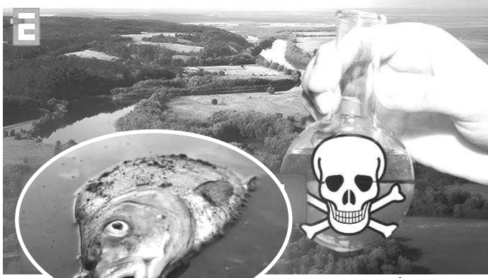
Фотоколаж із сайту – «Гарячі новини» або tsn.ua.

Так, 17 серпня на річці Сейм перед кордоном з Україною виявили токсичну пляму. Швидко з'ясувалося, звідки взялося забруднення. У Сейм скинули