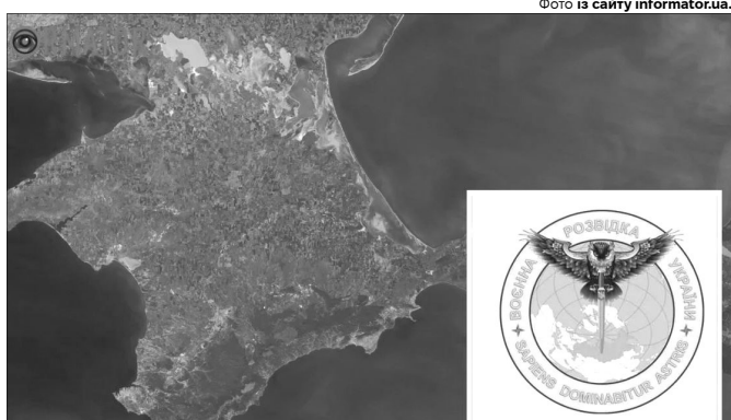
«Це була складна, зухвала, але успішна акція, яку не вперше проводять підрозділи ВМС»

18 вересня окупанти затримали всю сім'ю – батьків офіцера, сестру та неповнолітню племінницю. Їх незаконно утримували три дні,