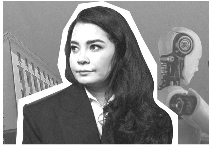
«Офіс Президента обдзвонює потенційних рекламодавців і просить не розміщувати рекламу в «Українській правді» та не приходити на наші заходи».

В інтерв'ю Інституту масової інформації пані Мусаєва заявила, що Офіс Президента тисне на редакцію. Зокрема, представники ОП обдзвонюють рекламодавців і просять не співпрацювати з «Українською правдою» – одним із найавторитетніших видань України, яке було засноване Георгієм Гонгадзе ще у 2000 році. Севгіль Мусаєва також додала, що власнику УП, чеському бізнесмену Томашу Фіалі, пропонували продати медіа.