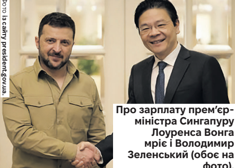
Про зарплату прем'єр-міністра Сінгапуру Лоуренса Вонга мріє і Володимир Зеленський (обом на фото).