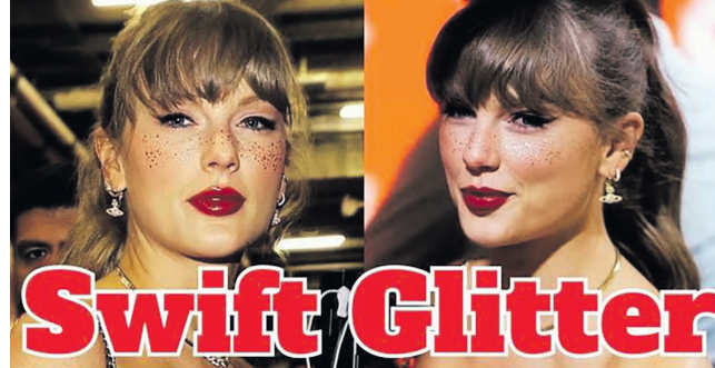
А ви б за такі блискітки виклали 16 доларів?