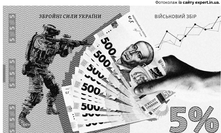
Військовий збір зріс із 1,5% до 5%.

Херсонська активістка Оксана Погомій теж пережила окупацію, навіть в умовах небезпеки допомагала містянам і зараз пече безкоштовний хліб для людей. У грудні 2022 року в Херсоні почала працювати волонтерська пекарня, яку організували активісти ГО «Справа Громад». Техніку для пекарні – хлібопічки, генера-