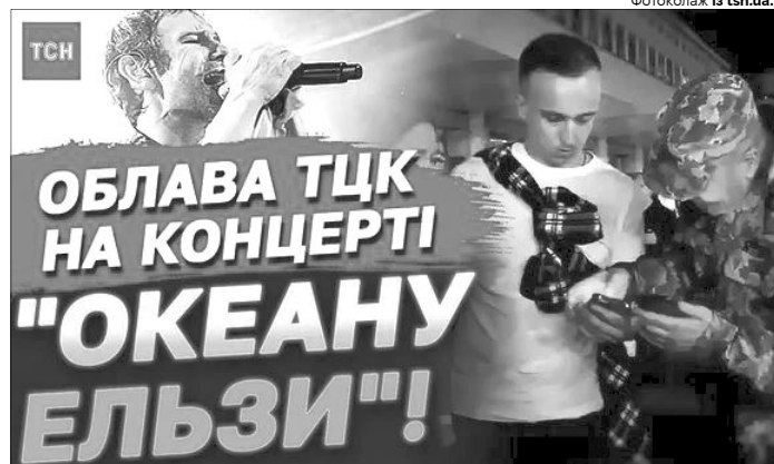
А як інакше чинити із ухилинтами? По-доброму їх держава уже запрошувала в ТЦК.

Так, після завершення виступу під стінами «Палацу Спорту» на відвідувачів чекало пів сотні працівників ТЦК та правоохоронців. Вони почали масово перевіряти документи у військовозобов'язаних чоловіків. Ба більше, за даними журналістів, декого з чоловіків навіть було затримано й відвезено у ТЦК. А також чимало відвідувачів отримали повістки. Присутні скандували військо-