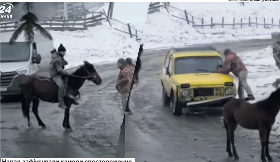
Напад зафіксували камери спостереження.

«Скоїв злочин через гнів за зниклого на війні сина», – пояснював на суді один із обвинувачуваних