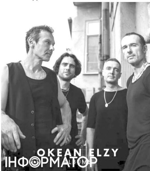
Гурт «Океан Ельзи» став частиною історії України. Адже усім нам випало жити в епоху, коли нескінченно: «Веселі, брате, часи настали...».