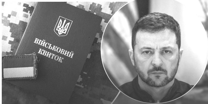
Як гадаєте, Зеленський реально не знав про кількість заброньованих, чи вдає із себе «доброго царя», а вину перекидає на відповідальних за мобілізацію?

До 15 листопада планується провести аудит рішень про визначення критично важливих підприємств та організацій, а Мінекономіки має проаналізувати