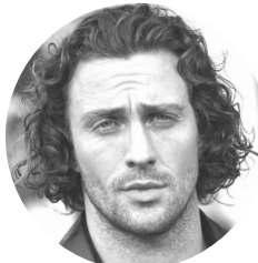
Обличчя знаменитості є майже ідеальним.

Такий висновок після дослідження зробив відомий пластичний хірург із Лондона Джуліан Де Сільва