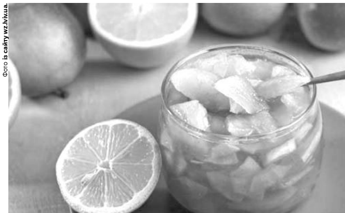
Варення готове до вживання відразу після того, як воно охолоне.