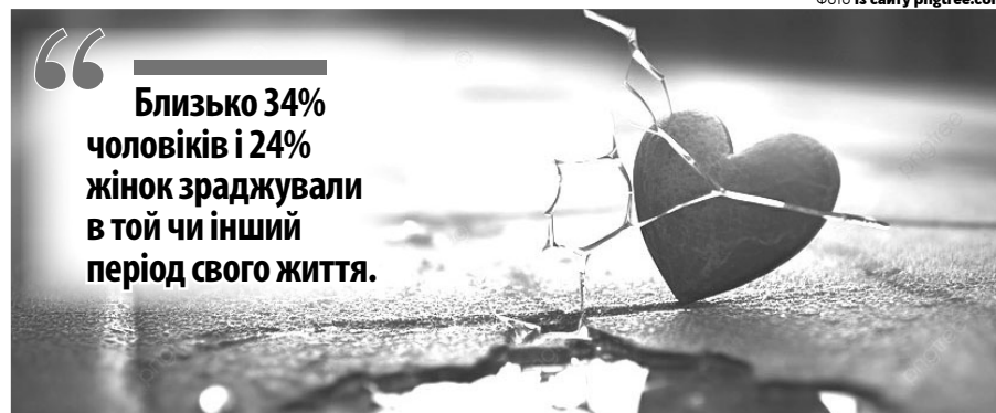
Чим більша любов, тим болючіша рана після зради.

міром, постійні мігрені або проблеми з серцем). Ба більше, цей стан продовжує надокучати навіть тоді, коли людина перебуває у нових стосунках.