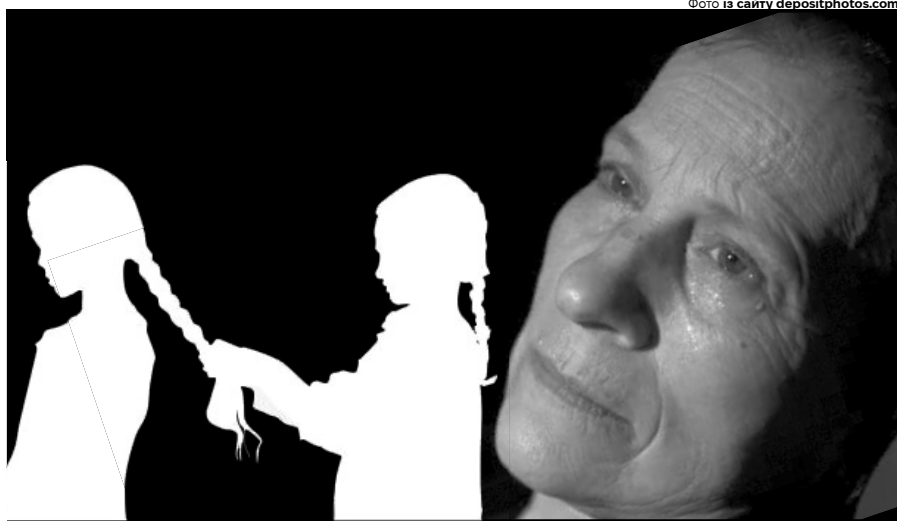
«Мої «Слізки»... Що ж із вами трапилося?»