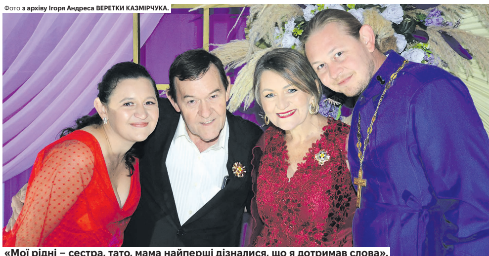
«Мої рідні – сестра, тато, мама найперші дізналися, що я дотримав слова».

«У 14 літ я пообіцяв віддати життя служінню Богові, якщо моя мама переможе рак...»