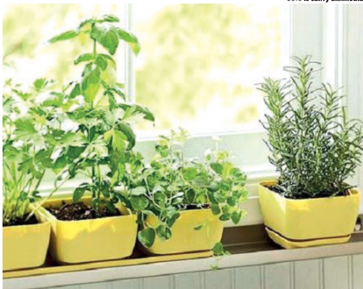
Жовтий колір вважають найкращим для притягнення багатства, а також – символом позитивної енергії.

но як слід дбати, аби вони залишалися здоровими. Чим краще росте рослина, тим більше грошей буде у вашому житті.