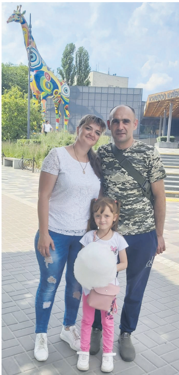
Фото – як спогад про те, якими вони були щасливими.