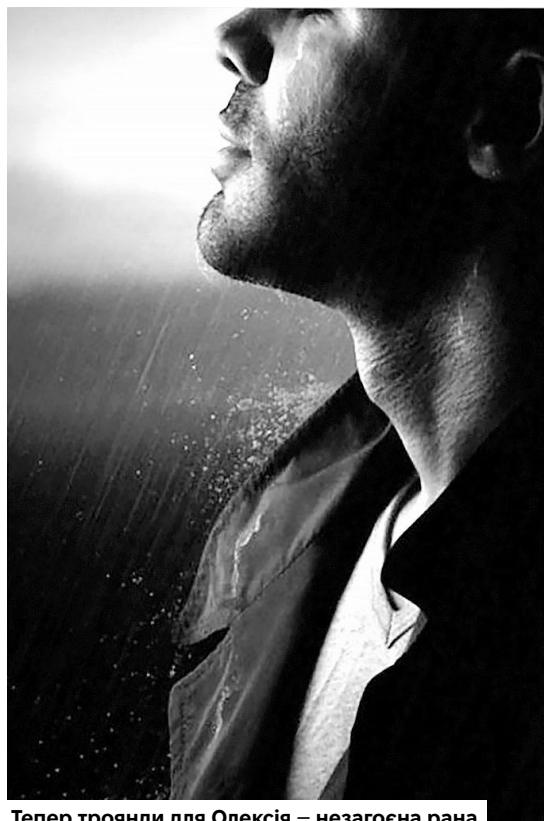
Тепер троянди для Олексія – незагоєна рана.