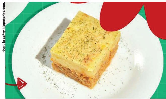
Ця страва має присмний запах орегано та нижній томатний смак.

Окрім хека можна сміливо використовувати філе минтая або тріски – запіканка вийде однаково смачною. Якщо хочете трішки пришвидшити процес її приготування, то беріть вже готовий рибний фарш із тріски або хека. Його знадобиться 400 г.