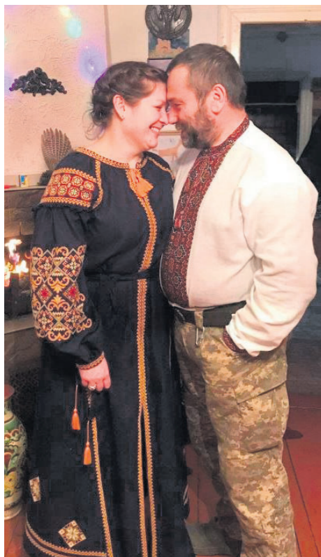
«Я була шокована, але впевнено відповіла: «Так!». Хіба це той час, коли можна чекати і роздумувати?»