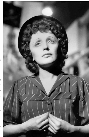
Знамениту французьку полюбили за унікальний голос, який неможливо було сплутати ні з чийм іншим.

У кінці життя Піаф отримала те, що вона вважала «незаслуженим». Це була нескінченна турбота Тео про жінку, якою він захоплювався. 27-річний красень проводив дні і ночі біля ліжка дружини. Він приносив Піаф милі подарунки, читав книги і всіляко намагався скрасити її останні дні.