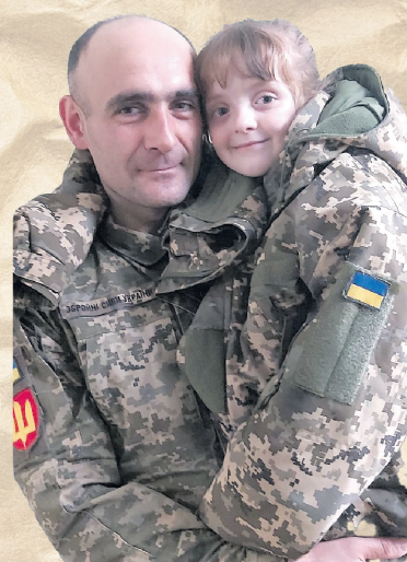
Коротка зустріч із донькою.