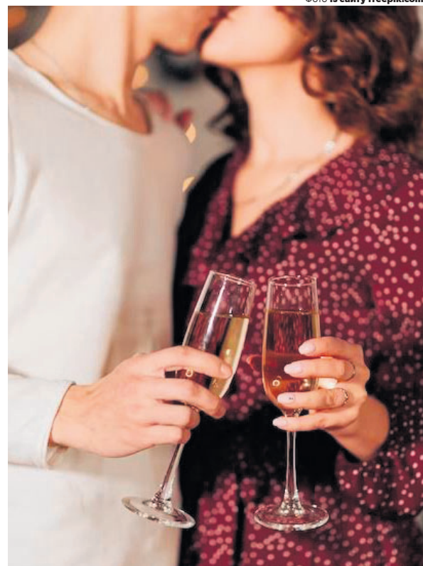
«Шампанське – нестримне і божевільне».

– А що з поцілунками? Більша ймовірність