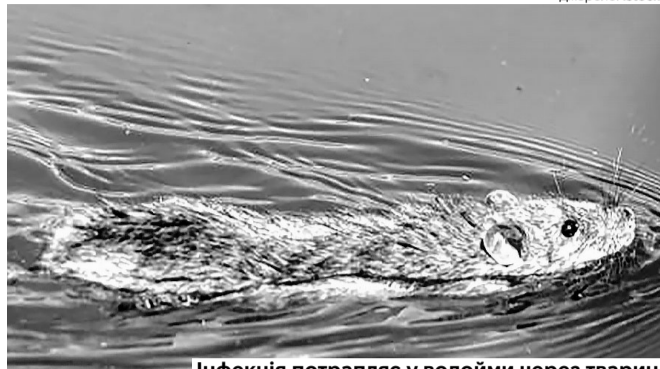
Інфекція потрапляє у водойми через тварин.

« Лептоспіроз – це інфекція, яка передається від тварин до людей. Основним збудником є бактерія Leptospira , яка потрапляє у воду із сечею інфікованих тварин, найчастіше, гризунів, а також худоби, собак і диких тварин. »