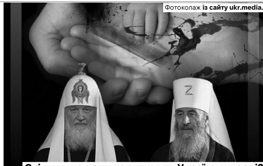
Скільки ще вони топтимуть Україну у крові?

А сьогодні на сторінках «Волині» звертаюся до вас із таким запитанням: чому працівники освіти, культури, депутати вашої команди і керівники волинських дер-