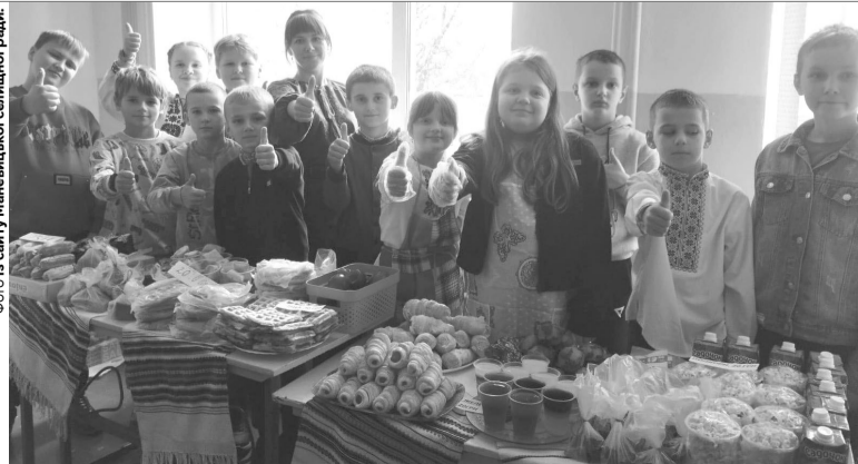
Охочі могли не тільки скуштувати смаколики, а й зробити свій внесок у добру справу.