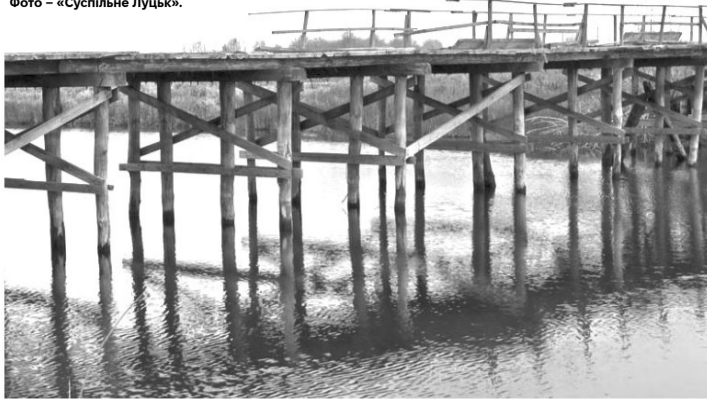
Аварійний сільський міст, листопад 2024 року.