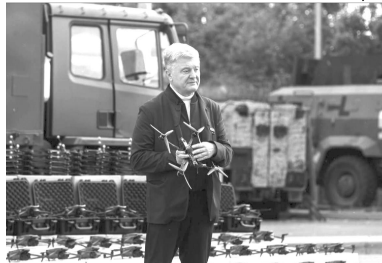
«За ці тисячу днів наша команда зробила 140 марш-кидків на фронт – не для селфі – щоб забезпечувати воїнів FPV-дронами, засобами РЕБ, бронетехнікою, засобами протидії технічній розвідці і всім тим, чого не дала держава».

Для захисту військових налагодили серійне виробництво і вже виготовили 3 тисячі індивідуальних детекторів безпілотних літальних апаратів «Ванільний цукорок». Також військовим поставляють багатодіапазонні системи оковних засобів РЕБ «Шатро» (340 одиниць).