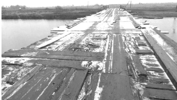
Такий вигляд має міст у селі Березичі станом на кінець листопада 2024 року.