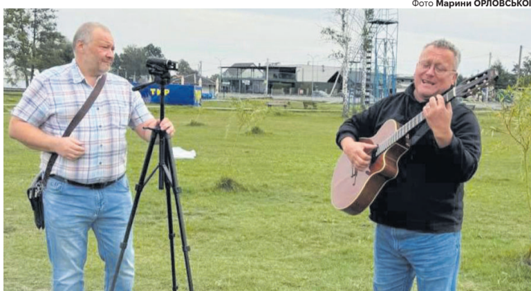
Пісні від лідера гурту «Чорні черешні» – учасникам екологічної толоки, зініційованої Шацьким НПП.

Сім літ – із 1989-го до 1996 року – гурт «Чорні черешні» активно працював. На його рахунок – чимало успішних виступів на фестивалях різного рівня. На «Оберезі» в Луцьку він тричі був лауреатом. А в 1991 році взяв участь спочатку у відбірковому турі конкурсу «Червона рута-91», де завоював перше місце в жанрі популярної музики. Згодом став володарем Гран-прі Міжнародного фестивалю естрадної музики «Марія» у місті Трускавець. Колектив об'їздив всю Україну, не раз бував у ближньому, як ми кажемо, зарубіжжі, а також – у Польщі, Німеччині.