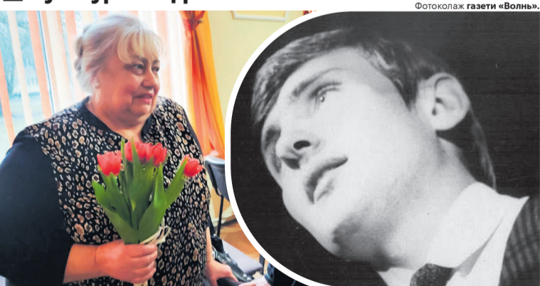
«Мала за щастя бути другом такої видатної людини».