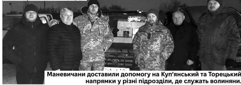
Маневичани доставили допомогу на Куп'янський та Торецький напрямки у різні підрозділи, де служать воїни.