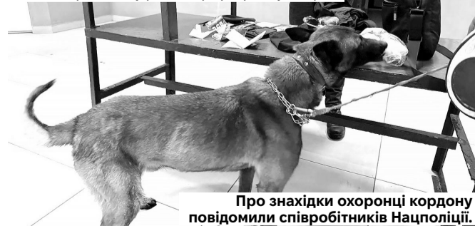
Про знахідки охоронці кордону повідомили співробітників Нацполіції.

та пристрій для їх вживання. Громадянин Франції, котрий опівночі повертався з України автобусом «Київ-Варшава», теж прихопив із собою наркотичну речовину. «Травичку» в його сумці прикордонники знайшли