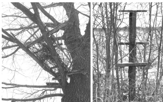
Подібних конструкцій виявили чимало.

Для довідки: браконьєр – це особа, яка займається полюванням і риболовлю в недозво-лених місцях, у заборонений час, відстрілом і