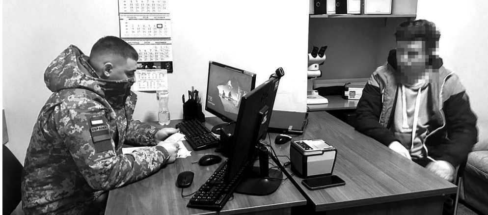
Це викликало здивування у прикордонників, адже ззовні особа була схожою на чоловіка.