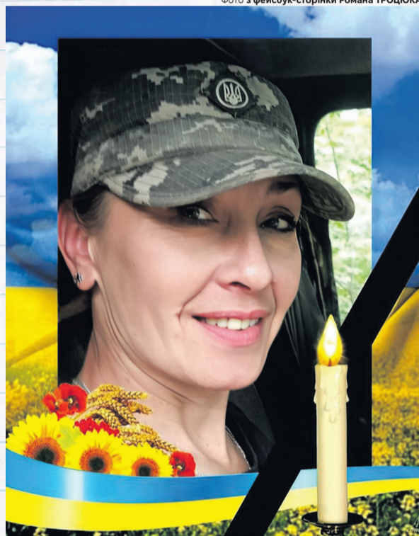
Побратими і посестри на передовій її називали наш «Світлячок», або наш «Ангел-охоронець»...

Дайте, будь ласка, відповідь на нього, пане Президенте України, пане «губернаторе» Волині, пане голово Волинської обласної ради і його перший заступнику, голови