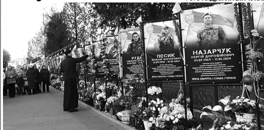
Освячення Алеї Героїв, яка поповнилася новими іменами.