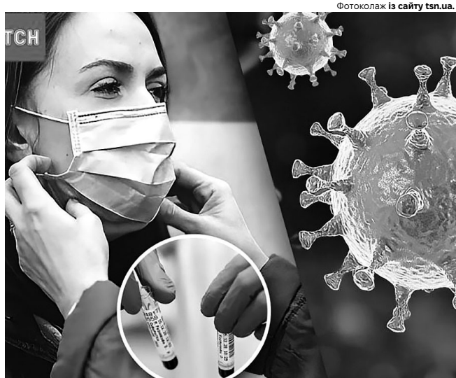
Фотоколлаж із сайту tsn.ua.

Всесвітня організація охорони здоров'я (ВООЗ) станом на цей час теж не визнала спалах метапневмовірусу глобальною надзвичайною ситуацією. Попри те, що кількість хворих невинно зростає, зокрема в Китаї, ВООЗ вважає, що