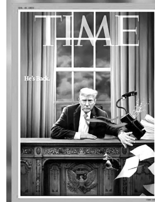
«Він повернувся» (He's Back).