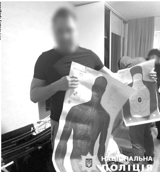
Зловмисники регулярно відвідували тир, де тренували свою вправність стрільби зі зброї.

Підозрюваним загрожує до 15 років позбавлення волі або довічне ув'язнення. «У ході слідства правоохоронці встановили, що двоє мешканців Київської області, 36-річний чоловік та 29-літня жінка, готують вбивство першого заступника міністра охорони здоров'я. Упродовж кількох місяців вони стежили за розпорядком дня та пересуванням потенційної жертви,