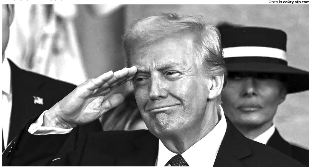
На президентську вахту в Білому домі у Вашингтоні заступив на чотири роки 47-й президент США 78-літній Дональд Трамп.