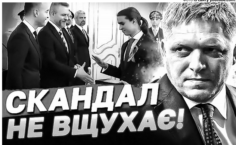
Юнак подав руку тільки словацькому міністру освіти Томашу Друкеру. А президенту – ні. Після цього Фіцо назвав школяра «некерованим підлітком».

Він вважає, що цією брехнею Пеллегріні хотів викликати страх і антиукраїнські настрої у