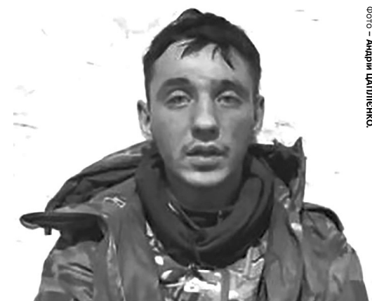
«Мене тупо кинули на м'ясо».

Також військовополонений росіянин розповів про розстріл двох бійців ЗСУ, які склали зброю: «Побачив двох українських військовослужбовців... Він їм крикнув: «Кидайте зброю». Ті, хто мав зброю, кинули її... Я зв'язувався з ко-