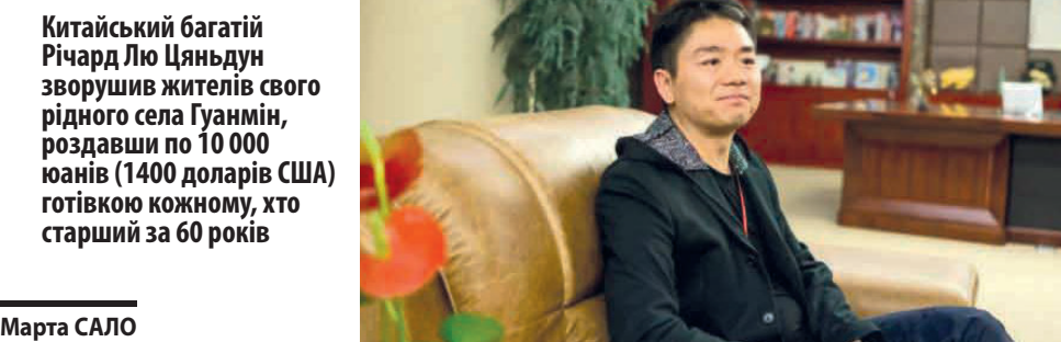
Китайський багатий Річард Лю Цяньдун зворушив жителів свого рідного села Гуанмін, роздавши по 10 000 юанів (1400 доларів США) готівкою кожному, хто старший за 60 років

Річард Лю робить так регулярно напередодні Нового року за місячним календарем. Мільярдер каже, що він безмежно вдячний своєму односельцю, як пожертвували для нього 500 юанів (70 доларів США) і 76 лець, коли він на початку 1990-х поїхав у Пекін навчатися в університеті на початку 1990-х років.