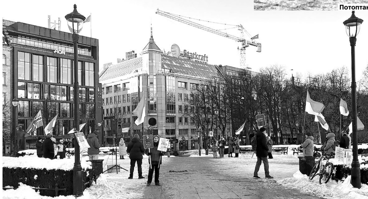
Українці в Осло закликали світ до вольових рішень щодо закінчення війни в Україні.

Листи ж сповнені найрізноманітнішого змісту. Наприклад, Міністерство здоров'я просить відповісти на запитання про донорство, університет Копенгагена – про ставлення та багачення населення до переробки пластику, статисти цікавляться міркуваннями українців про щоденне життя, проблеми та самопочуття в Данії, а лікарі невтомно закликають пройти профільні профілактичні огляди... Це, звісно, далеко не повний перелік