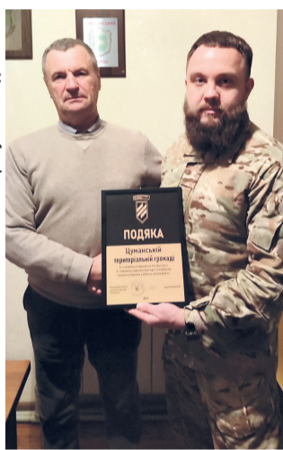
Нагорода Цуманській територіальній громаді від 100-ї бригади.

Продовження розповіді про цуманчан – на с. 8