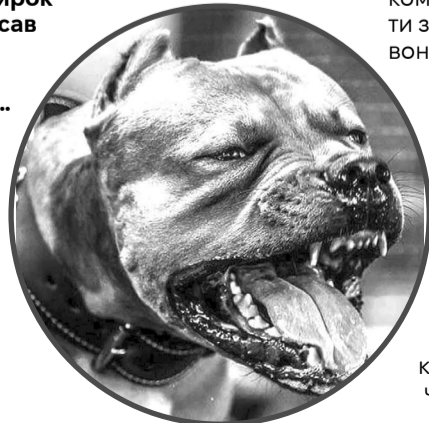
Американський стаффордширський тер'єр вказаний у переліку порід, власники яких зобов'язані виховувати їх лише у намордниках.