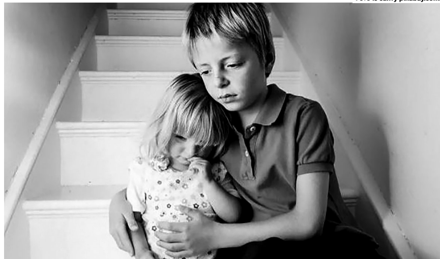
«У братика та сестрички мають бути сім'я, дитинство, дім».