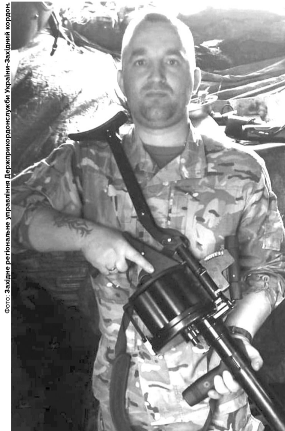
Після отримання важкого поранення голови військовослужбовець проходить реабілітацію та мріє повернутися на службу.

донного загону, де забезпечував охорону та оборону українсько-білоруської ділянки кордону. Згодом воїн був переведений