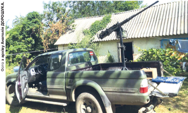
Пікап, який з Цумани доставили на передову, обладнано кулеметом.