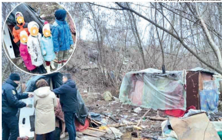
Ось у цьому «поселенні» посеред лісосмуги і виявили діток...

Малеча – віком від 4 до 9 років – спала на землі і ходила босоніж, бо не мала ні взуття, ні шкарпеток. Виявилось, що їхня мати – з Дубна Рівненської області, а її співмешканець – із Волині. У сусідньому наметі живуть брат та матір цього чоловіка