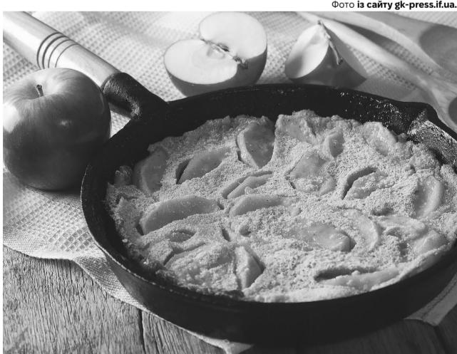
Маєте під рукою кефір, яйця та яблука? Тоді швидко готуйте таку смакоту!