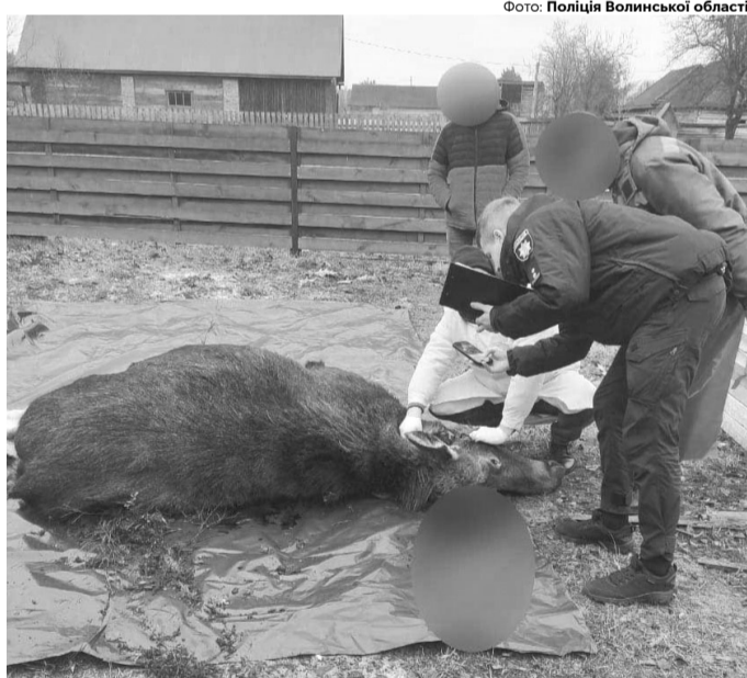
Розтин показав, що вона виношувала двох лосенят.