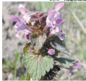
Ось так красиво уже цвіте глуха кропива.